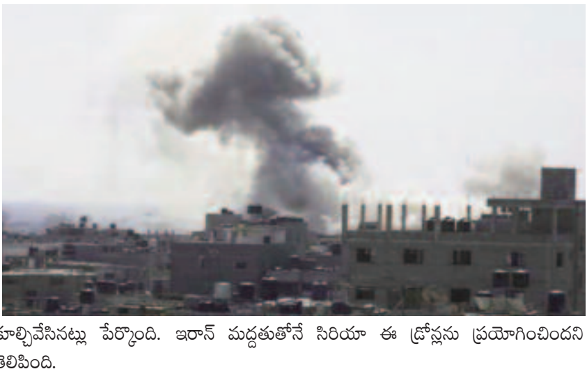
కూల్చినేసినట్లు పేర్కొంది. ఇరాన్ మద్దతుతోనే సిరియా ఈ ద్రోష్లను ప్రయోగించిందని తెలిసింది.

33 మంది మృతి ఇంటర్నెట్ డెస్క్: అక్టోబర్ 19 (తరణం బ్యూరో) గాజాపై ఇజ్రాయెల్ దాడులు కొనసాగుతూనే ఉన్నాయి. తాజాగా ఉత్తర గాజాలో జరిపిన వైమానిక దాడుల్లో 33 మంది పాల్స్తీనా వాసులు మృతి చెందారు.ఈ మేరకు అక్కడి అధికారిక వార్తా సంస్థ వెల్లడించింది.ఉత్తర గాజాలోని జబాలియా శిబిరంపై శుక్రవారం రాత్రి ఇజ్రాయెల్ వైమానిక దాడులతో విరుచుకుపడింది. మృతుల్లో 21 మంది మహిళలే కావడం గమనార్హం. ఈ దాడుల్లో కనీసం 85 మందికి తీవ్ర గాయాలయ్యాయి. అనేక మంది శిథిలాల కింద చిక్కుకుని పోయారు. దీంతో మృతుల సంఖ్య మరింత పెరిగే అవకాశం ఉన్నట్లు తెలుస్తుంది. ఇదిలా ఉండగా.. ఇజ్రాయెల్ దాడుల కారణంగా ఇప్పటివరకు 42,500 మందికి పైగా మృతి చెందినట్లు గాజా ఆరోగ్య శాఖ ఓ ప్రకటనలో పేర్కొంది.ఇజ్రాయెల్ పై సిరియా వైమానిక దాడులు..మరోవైపు, ఇజ్రాయెల్ పై సిరియా వైమానిక దాడులకు యత్నించింది. తమ భూభాగాన్ని లక్ష్యంగా చేసుకుని జరిపిన వైమానిక దాడులను సమర్థవంతంగా ఎదుర్కొన్నట్లు ఐడిఎఫ్ వెల్లడించింది. అది తమ భూభాగంలోకి ప్రవేశించకముందే దాన్ని