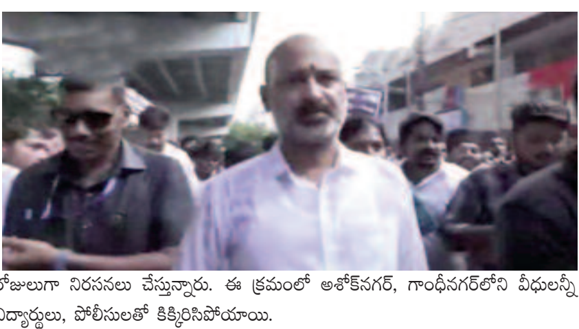
రోజులుగా నిరసనలు చేస్తున్నారు. ఈ క్రమంలో అశోక్‌నగర్, గాంధీనగర్‌లోని వీధులన్నీ విద్యార్థులు, పోలీసులతో కిక్కిరిసిపోయాయి.

హైదరాబాద్: అక్టోబర్ 19 (తరణం బ్యూరో)కేంద్ర మంత్రి బండి సంజయ్ హైదరాబాద్‌లోని అశోక్‌నగర్ చౌరస్తాకు వెళ్లారు. కేంద్ర మంత్రి రాకతో భారీగా అక్కడికి గ్రూప్-1 అభ్యర్థులు తరలివచ్చారు.వారిని పరామర్శించి.. సమస్యలను అడిగి తెలుసుకున్నారు. అనంతరం చలో సచివాలయానికి పిలుపునిచ్చారు. గ్రూప్-1 అభ్యర్థులతో కలిసి సచివాలయం వైపు ర్యాలీగా బయలుదేరారు. దీంతో ఈ ర్యాలీని పోలీసులు అడ్డుకున్నారు. ఈ సందర్భంగా పోలీసుల తీరుపై బండి సంజయ్ ఆగ్రహం వ్యక్తం చేశారు. సీఎంస కలిసి వాస్తవాలు వివరించేందుకు వెళ్తున్నామని చెప్పారు. సచివాలయానికి వెళ్లి తీరుతామని స్పష్టం చేశారు. దీంతో పోలీసులు బండి సంజయ్‌ను అదుపులోకి తీసుకున్నారు.గ్రూప్-1 మెయిన్స్ పరీక్షల వాయిదా, జీవో 29ని రద్దు చేయాలని కోరుతూ.. ట్రిలిమ్స్ ఉత్తీర్ణులు సహా వారికి మద్దతుగా నిరుద్యోగ అభ్యర్థులు హైదరాబాద్‌లో గత కొన్ని