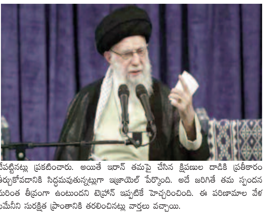
చేపట్టినట్లు ప్రకటించారు. అయితే ఇరాన్ తమపై చేసిన క్షిపణుల దాడికి ప్రతికారం తీర్చుకోవడానికి సిద్ధమవుతున్నట్లుగా ఇజ్రాయెల్ పేర్కొంది. అదే జరిగితే తమ స్పందన మరింత తీవ్రంగా ఉంటుందని టెహ్రాన్ ఇప్పటికే హెచ్చరించింది. ఈ పరిణామాల వేళ ఖమేనీని సురక్షిత ప్రాంతానికి తరలించినట్లు వార్తలు వచ్చాయి.

ఇరాన్ సుప్రీం లీడర్ టెహ్రాన్: అక్టోబర్ 19. (తరణం బ్యూరో)హమాస్ మిలిటెంట్ సంస్థ అధినేత యాహ్సీ సిస్టర్‌ను ఇజ్రాయెల్ దళాలు హతమార్చడంపై ఇరాన్ సుప్రీం లీడర్ అయతుల్లా అలీ ఖమేనీ స్పందించారు.సిస్టర్ మృతి బాధ కలిగిస్తోంది.. అయినప్పటికీ అతడు అమరుడు కావడంతో అంతా అయిపోయినట్లు కాదని ఆయన వ్యాఖ్యానించారు. ఇజ్రాయెల్ దాడిలో అతడు చనిపోయినా హమాస్ ఇంకా ఉనికిలోనే ఉందని.. ఎప్పటికీ ఉంటుందని ఆయన పేర్కొన్నారు. “శత్రువులు తమపై విపరీత దాడులకు పాల్పడుతున్నా సిస్టర్ దృఢ సంకల్పంతో వారికి ఎదురు నిలిచారు. వారి వ్యూహాలకు దీటుగా బదులిచ్చారు. 2023 అక్టోబరు 7న ఇజ్రాయెల్‌పై జరిపిన దాడులకు సూత్రధారిగా వ్యవహరించి ఇజ్రాయెల్‌ను ఆయన దెబ్బ కొట్టిన తీరును ప్రపంచం ఎప్పటికీ మరిచిపోదు” అని ఖమేనీ అన్నారు. ఇజ్రాయెల్-హెజ్బోల్లా మధ్య జరుగుతున్న పోరులో హమాస్ చీఫ్ నసర్లలా మరణం తర్వాత లెబనాన్‌లోకి తన బలగాలను పంపేందుకు ఇరాన్ సిద్ధంగా ఉందని ఆ దేశ ఉన్నతస్థాయి అధికారిని ఉటంకిస్తూ అంతర్జాతీయ మీడియా వెల్లడించింది.ఇటీవల ఇజ్రాయెల్‌పై ఇరాన్ ప్రత్యక్ష దాడికి దిగిన సంగతి తెలిసిందే. దాదాపు 200 బాలిస్టిక్ క్షిపణులు ప్రయోగించింది. అనంతరం దీనిపై ఖమేనీ స్పందిస్తూ హమాస్ అప్పటి అధినేత ఇస్మాయెల్ హనియా, హెజ్బోల్లా చీఫ్ హసన్ నసర్లలా, నిల్దోర్హుషన్ మరణానికి ప్రతికారంగా ఈ దాడులు