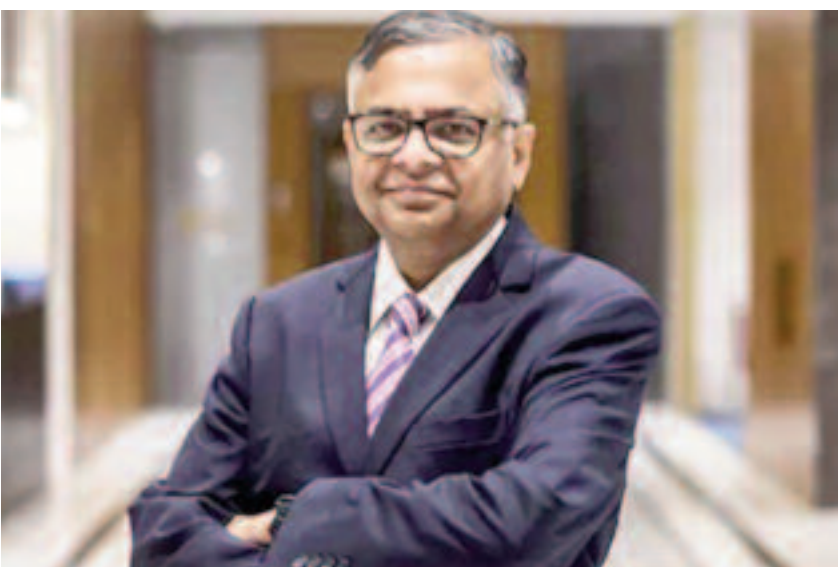
తయారీ రంగాల్లో వచ్చే ప్రతీ ఉద్యోగానికి పరోక్షంగా 8-10 మందికి ఉపాధి అవకాశాలు లభిస్తాయని చంద్రశేఖరన్ అన్నారు.

దిల్లీ: అక్టోబర్ 15. (తరణం బ్యూరో) రాబోయే ఐదేళ్లలో తయారీ రంగంలో టాటా గ్రూపు 5 లక్షల ఉద్యోగాలు సృష్టించబోతోందని ఆ గ్రూప్ చైర్మన్ ఎన్. చంద్రశేఖరన్ తెలిపారు. సెమీ కండక్టర్, ఎలక్ట్రీక్ వెహికల్, బ్యాటరీ, సంబంధిత రంగాల్లో ఈ ఉద్యోగాలు రానున్నాయని చెప్పారు. ఇండియన్ ఫౌండేషన్ ఫర్ క్వాలిటీ మేనేజ్మెంట్ సింపోజియంలో ఈమేరకు మంగళవారం ఆయన మాట్లాడారు. తయారీరంగంలో పెద్దఎత్తున ఉద్యోగ సృష్టి జరగకుండా అభివృద్ధి చెందిన దేశంగా మారడం అంత సులువు కాదని చెప్పారు. సెమీ కండక్టర్, ప్రెసిషన్ మానుఫాక్చరింగ్, అసెంబ్లీ, ఎలక్ట్రీక్ వెహికల్, బ్యాటరీలు, సంబంధిత రంగాల్లో టాటా గ్రూపు పెట్టుబడులు రాబోయే ఐదేళ్లలో ఐదు లక్షల ఉద్యోగాలు సృష్టించబోతోందని చంద్రశేఖరన్ అన్నారు. అస్సాంలోని సెమీ కండక్టర్ ఫ్లాంట్, ఎలక్ట్రీక్ వాహనాలు, బ్యాటరీలకు సంబంధించి పలు ఫ్లాంట్లను ఏర్పాటుచేస్తున్నట్లు ఈ సందర్భంగా ప్రస్తావించారు. ఈ ఫ్లాంట్ల వల్ల పర్యావరణ వ్యవస్థలో మరిన్ని చిన్నచిన్న పరిశ్రమలు సైతం ఏర్పాటుకానున్నాయని చెప్పారు. తయారీ రంగంలో ఈ స్థాయిలో ఉద్యోగాల కల్పున జరగాలంటే ప్రభుత్వ సహకారం కూడా అవసరమని పేర్కొన్నారు. సెమీ కండక్టర్ వంటి