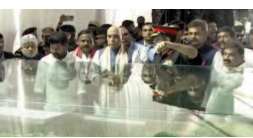
చుట్టూ దాదాపు 27 కి.మీ. రోడ్లను నిర్మించనున్నారు. కొత్త వీఎల్ఎఫ్ కేంద్రాన్ని 2027 లోగా పూర్తి చేయాలని లక్ష్యంగా నిర్దేశించుకున్నట్లు అధికార వర్గాలు తెలిపాయి.

పూడూరు: అక్టోబర్ 15. (తరణం బ్యూరో) భారత నౌకాదళానికి సంబంధించిన 'వెరీ లో క్రిక్యేన్స్' (వీఎల్ఎఫ్) కమ్యూనికేషన్ ట్రాన్స్మిషన్ స్టేషన్ రాడార్ కేంద్రానికి కేంద్ర రక్షణ శాఖ మంత్రి రాజ్ నాథ్ సింగ్ శంకుస్థాపన చేశారు. వికారాబాద్ జిల్లా పూడూరు మండలం దామగుండం అటవీ ప్రాంతంలో ఈ కార్యక్రమం జరిగింది. ఈ కార్యక్రమంలో రాష్ట్ర ముఖ్యమంత్రి రేవంత్ రెడ్డి, కేంద్ర మంత్రి బండి సంజయ్, తెలంగాణ శాసనసభాపతి గడ్దం ప్రసాద్ కుమార్, నేవీ ఉన్నతాధికారులు తదితరులు పాల్గొన్నారు. ఈ స్టేషన్ నిర్మాణానికి అటవీ శాఖకు చెందిన 2,900 ఎకరాలను రాష్ట్ర ప్రభుత్వం విశాఖపట్నం కేంద్రంగా పనిచేస్తున్న 'ఈస్టర్న్ నావెల్ కమాండో'కు ఆరు నెలల క్రితమే అప్పగించింది. దామగుండంలో నేవీ రాడార్ స్టేషన్ తో పాటు టౌన్షిప్ నిర్మాణం కానుంది. ఇందులో పాఠశాలలు, ఆసుపత్రి, బ్యాంక్, మార్కెట్ వంటి సదుపాయాలుంటాయి. నేవీ యూనిట్ లో సుమారు 600 మంది ఉద్యోగులు, ఇతర సిబ్బంది ఉంటారు. మొత్తంగా ఈ టౌన్షిప్ లో సుమారు 2,500-3,000 మంది నివసించే అవకాశముంది. ఈ ప్రాజెక్టులో భాగంగా దామగుండం రిజర్వ్ ఫారెస్టు