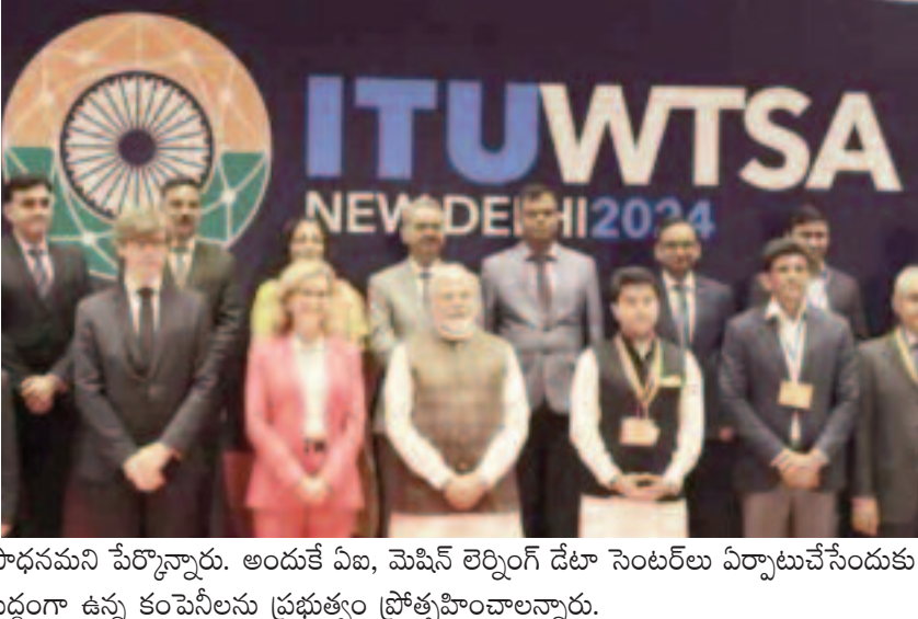
సాధనమని పేర్కొన్నారు. అందుకే ఏట, మెషిన్ లెర్నింగ్ డేటా సెంటర్లు ఏర్పాటుచేసేందుకు సిద్ధంగా ఉన్న కంపెనీలను ప్రభుత్వం ప్రోత్సహించాలన్నారు.

ఆకాశ్ అంబానీ ఇంటర్నెట్ డెస్క్: అక్టోబర్ 15. (తరణం బ్యూరో) నాలుగేళ్లకు ఒకసారి జరిగే వరల్డ్ టెలికమ్యూనికేషన్స్ స్టాండర్డైజేషన్ అసెంబ్లీ-2024 ఈవెంట్ ఈ ఏడాది దిల్లీలో అట్టహాసంగా మొదలైంది. ఈ ఈవెంట్ ను ప్రధాని నరేంద్ర మోదీ ప్రారంభించారు. కేంద్రమంత్రి జ్యోతిరాదిత్య సింధియాతో కలిసి ఎగ్జిక్యూటివ్ స్టాళ్లను పరిశీలించారు. దేశీయ ఆవిష్కరణలు ప్రదర్శించేందుకు నిర్వహించే ఇండియన్ మొబైల్ కాంగ్రెస్ 2024 ఈవెంట్ 8వ ఎడిషన్ ను కూడా ఈ కార్యక్రమంలోనే నిర్వహించారు. ఈ సందర్భంగా డేటా సెంటర్ల గురించి రిలయన్స్ జియో చైర్మన్ ఆకాశ్ అంబానీ ప్రస్తావించారు. 'అత్యునిర్బంధ'లో భాగంగా.. డేటా సెంటర్లను భారత్ లో నెలకొల్పే సామర్థ్యం ఉన్నందున అవి దేశంలోనే ఉండాలని ఆకాశ్ అన్నారు. డేటా సెంటర్ పాలసీ 2020 ముసాయిదాను సవరించే ప్రక్రియను వేగవంతం చేయాలని ప్రభుత్వాన్ని కోరారు. దీంతో భారత్ లోని డేటా మొత్తం ఇక్కడి డేటా సెంటర్ లోనే ఉంటుందన్నారు. భారత్ ఏట సాంకేతికతను అందిపుచ్చుకోవాలని ఆకాశ్ అంబానీ అన్నారు. విద్య, వైద్యం, వ్యవసాయం.. ఇలా ప్రతి రంగంలోనూ ముందుకెళ్లేందుకు ఏట ఓ విప్లవాత్మక