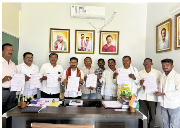
ఈ కార్యక్రమాన్ని విజయవంతం చేయాలని పిలుపునిచ్చారు. ఈ కార్యక్రమంలో కుమ్రం భీం విగ్రహ నిర్వహణ కమిటీ సభ్యులు, కాంగ్రెస్ పార్టీ నాయకులు తదితరులు పాల్గొన్నారు.