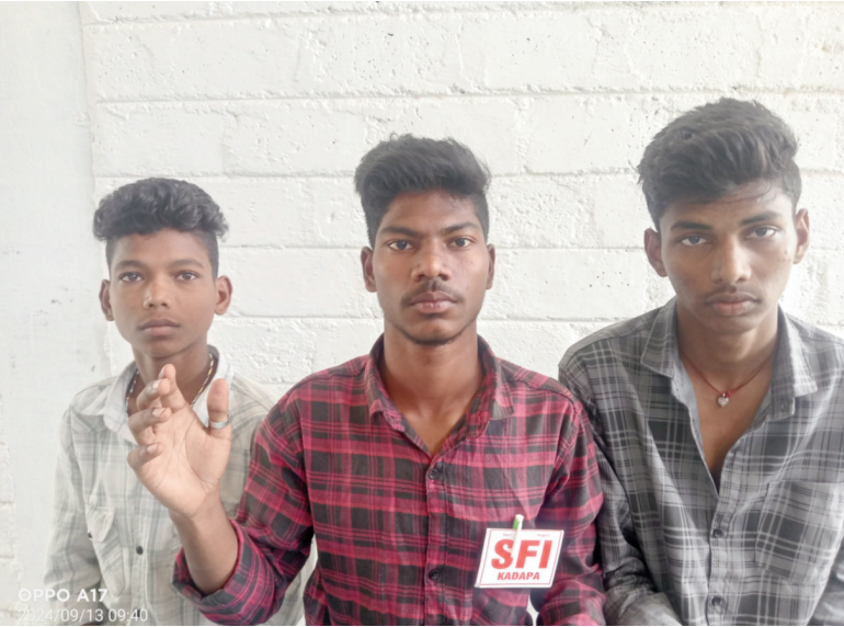
కడప, చిన్న చౌక్, సెప్టెంబరు-16-(తరణం విలేఖరి)-భాజపేట మండలంలోని స్థానిక బాయ్స్ హై స్కూల్, కస్తూర్బా స్కూల్, గర్ల్స్ హై స్కూల్, మోడల్ స్కూల్ , అంజనేయ కొట్టాల పరమేశ్వర్ స్కూల్ లలో మౌలిక సదుపాయాలు కల్పించాలని భారత