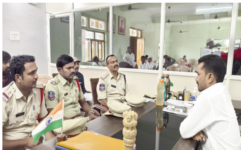
జాగ్రత్తలు పాటించాలన్నారు.ఈ కార్యక్రమంలో డిఎస్పీ నాగేందర్, సిఐ మొగలి,ఎస్సై మనోహర్, విద్యుత్ శాఖ అధికారులు, గ్రామ పంచాయతీ అధికారులు తదితరులు పాల్గొన్నారు.

ఖానాపూర్( ఉట్పూర్ )సెప్టెంబర్ 14(తరణం బ్యూరో )వినాయక నిమజ్జన వేడుకలను శాంతియుత వాతావరణంలో జరుపుకోవాలని ఖానాపూర్ ఎమ్మెల్యే వెడ్డ బొజ్జ పటేల్ అన్నారు.శనివారం ఉట్పూర్ మండల కేంద్రంలోని ఎమ్మెల్యే క్యాంపు కార్యాలయంలో పోలీసు ఉన్నతాధికారులు,విద్యుత్ శాఖ గ్రామపంచాయతీ అధికారులతో సమావేశం నిర్వహించి పలు విషయాలపై చర్చించారు.ఈ సందర్భంగా ఎమ్మెల్యే అధికారులకు పలు సూచనలు చేశారు.వినాయక నిమజ్జన శోభాయాత్రలో ప్రజలకు ఎలాంటి ఇబ్బంది కలగకుండా చూసుకోవాలని అధికారులను ఆదేశించారు.ఎలాంటి అవాంఛనీయ సంఘటనలు జరగకుండా పోలీసులు ముందస్తుగా గట్టి బందోబస్త నిర్వహించాలని సూచించారు. విద్యుత్ శాఖ అధికారులు కరెంటు విషయంలో ప్రజలకు ఇబ్బందులు కలగకుండా చూడాలని అన్నారు.ప్రజలకు విద్యుత్ తీగలు తగలకుండా ముందస్తుగా చర్యలు తీసుకోవాలని ఆదేశించారు.చెరువుల వద్ద హైమన్ విద్యుత్ దీపాలు అమర్చాలని సూచించారు.గ్రామ పంచాయతీ సిబ్బంది సైతం