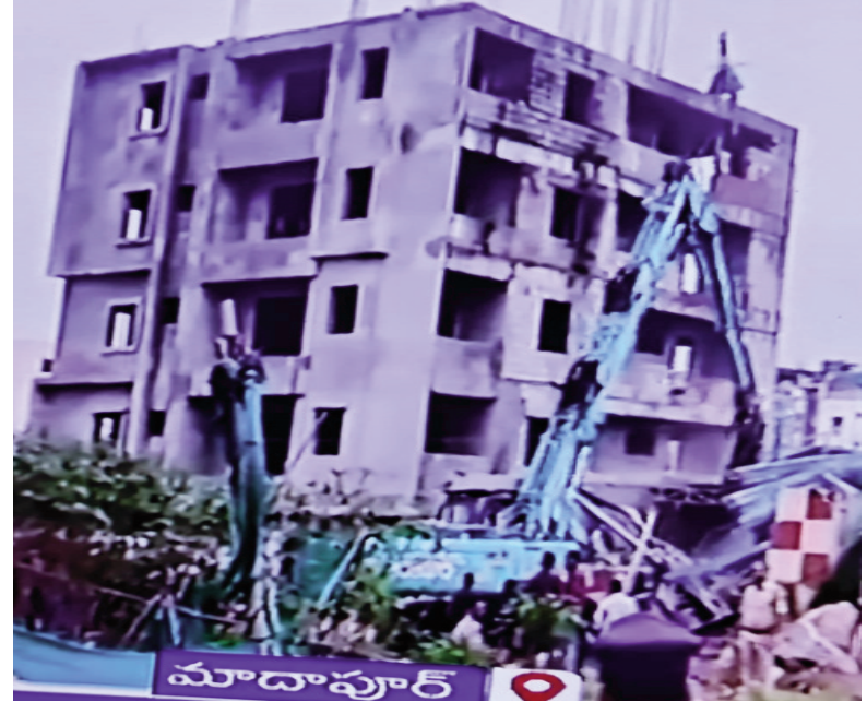
యంత్రాంగం పట్టించుకోకపోవడంతో కబ్బాకుగురయింది. ఈ చెరువు ఆక్రమణలపై శేరిలింగంపల్లిఎమ్మెల్యే అరేకపూడి గాంధీ గత ఏడాది రెవెన్యూ,ఇరిగేషన్ అధికారులకు ఫిర్యాదులు చేశారు.

హైద్రా కూబ్లి వేతలు శేరిలింగంపల్లి, సెప్టెంబర్ 09 (తరణం ప్రతినిధి): శేరిలింగంపల్లి నియోజకవర్గంలో ఎన్టీఎల్, బిఫర్ జోన్లలో చేపట్టిన నిర్మాణాలపై హైద్రా కొరడా ఝులిపిస్తూనే ఉంది. తాజాగా అదివారం శేరిలింగంపల్లి, బాలాసగర్ మండలాల పరిధిలో విస్తరించి ఉన్న సున్నం చెరువులో కూబ్లివేతలు చేపట్టారు. శేరిలింగంపల్లి, బాలాసగర్ మండలాల పరిధిలో సున్నం చెరువు 26 ఎకరాలలో విస్తరించి ఉంది. అయితే ఈ చెరువు చాలాకాలంగా కబ్బరలకు గురవుతుంది. 2013లో సర్వే నిర్వహించినఇరిగేషన్ అధికారులు ఈ చెరువులో 15.23 ఎకరాల్లో నీళ్లు ఉన్నాయని నిర్ధారించారు. 2013లోహెచ్ఎండ్ఐ 4805 ఐటీ నంబర్ ఇచ్చింది. చెరువుఎన్టీఎల్ పరిధిలోనే సర్వే నంబర్లు 13, 14, 16 ఉన్నట్లుగా నిర్ధారించింది. ఆ సర్వే నంబర్లలోనే బిఫర్ జోన్ లు ఉన్నాయి. సున్నం చెరువు ఎన్టీఎల్, బిఫర్ జోన్ నునిర్ధారిస్తూ 2014 మే 14న ప్రిలిమినరీ నోటిఫికేషన్ జారీ చేశారు. హెచ్ఎండ్ఐ, జీహెచ్ఎంసీ. ఇరిగేషన్, రెవెన్యూ అధికారులు సంయుక్తంగా నిర్ధారించిన ఎన్టీఎల్ కు ఫెన్సింగ్ ఏర్పాటు చేశారు. కొందరు కబ్బరాయు ఖ్లు దానిని ముందుకుజరపగా..ఇంకొందరు ఫెన్సింగ్ లేకుండా చేశారు. సర్వే నంబర్ 13, 14లో చెరువు భూమి లేకుండా చేయగా, ప్రస్తుతం సర్వే నంబర్ 16 పై కబ్బా రాయుళ్ల కన్నుపడింది. ఎన్టీఎల్, బిఫర్ జోన్ లేకుండాచేయడానికి గత ఓలిగెఎస్ పార్టీ నేతల సూచనల మేరకు ఇలా రోడ్డు నిర్మించారన్న ఆరోపణలు ఉన్నాయి. మేధుల్ మల్లాజిగిరి జిల్లా బాలాసగర్ మండలం అల్లాపూర్ రెవెన్యూ పరిధిలోకి వచ్చే ఈ చెరువు, రంగారెడ్డిజిల్లా శేరిలింగంపల్లి మండలం లోని గుట్ట బేగంపేట రెవెన్యూపరిధిలోనూ కొంత ఉంటుంది. రెండు జిల్లాల