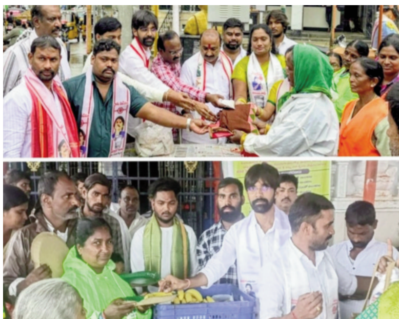
సైనికులు, అభిమానులు, తదితరులు పాల్గొన్నారు.