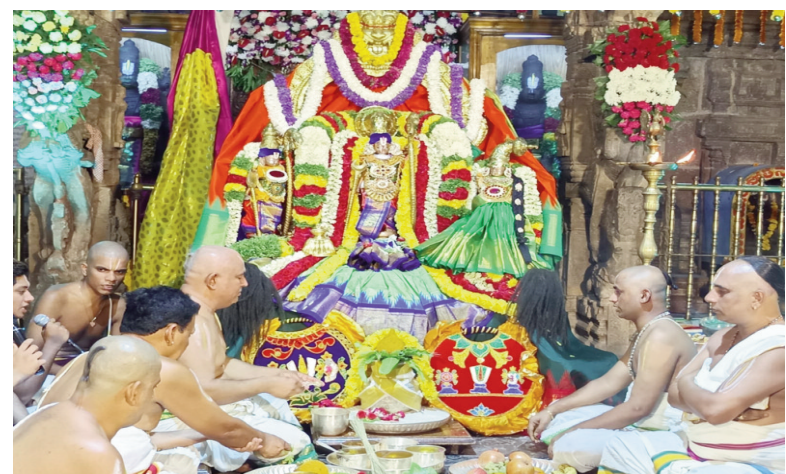
శ్రీరామ రక్షా స్తోత్రము, హనుమాన్ చాలీసా హయగ్రీవ స్తోత్రము, రక్షణ మూర్తి స్తోత్రము ఉంటాయన్నారు. స్వామివారికి నాదస్వర వాయిద్యము, అంగరంగ వైభవంగా స్వామివారి పౌర్ణమి కళ్యాణం నిర్వహించడం జరుగుతుందని వారు తెలిపారు. స్వామి వారి కళ్యాణంలో భక్తులు పాల్గొనాలని, స్వామి వారి కృప పొందాలని వారు కోరారు.

ఒంటిమిట్ట జూలై 19 తరణం విలేఖరి రెండవ అయోధ్యగా పేరుగాంచిన ఒంటిమిట్ట కోదండ రామాలయంలో శనివారం స్వామివారికి తిరుపతి తిరుమల దేవస్థానం ఆధ్వర్యంలో స్తవన తిరుమంజన సేవా కార్యక్రమాన్ని నిర్వహించనున్నారు. ఇందులో భాగంగా స్వామివారికి టీటీడీ అధికారులు పట్టు వస్త్రాలు సమర్పిస్తారు. అర్చకులు పవిత్ర జలాలతో, సుగంధ ద్రవ్యాలతో, చందనం లేపనములతో శాస్త్రోక్తంగా అభిషేకాలు నిర్వహిస్తారు. ఆదివారం వ్యాస పౌర్ణమి సందర్భంగా ఒంటిమిట్ట కోదండ రామాలయంలో టీటీడీ అధికారులు ప్రత్యేక సాంస్కృతిక కార్యక్రమాలు ఏర్పాటు చేయనున్నారు. ఇందులో భాగంగా అన్నమాచార్య సంతీర్తనలు, హయగ్రీవ స్తోత్రము, వ్యాస పౌర్ణమి విశిష్టత వివరిస్తారు. ఉదయం స్వామివారికి సుప్రభాత సేవ, సామూహిక విష్ణు సహస్రనామ పారాయణం, ఆదిత్య హృదయం,