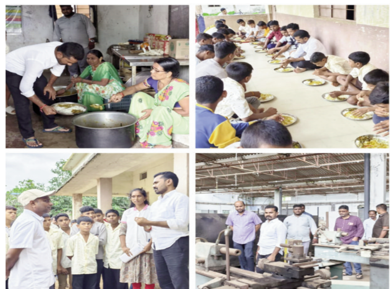
రంగంలో రాజించాలన్నారు. పాఠశాలలో నెలకొన్న సమస్యలను పరిష్కరిస్తామని తెలిపారు. అనంతరం ఐటిఐ కళాశాలను సందర్శించారు. కళాశాలలో గల పరికరాలు, యంత్రాలను పరిశీలించారు. ఈ కార్యక్రమంలో పాఠశాల విద్యార్థులు, ప్రధానోపాధ్యాయులు తదితరులు పాల్గొన్నారు.