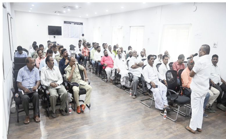
అతువదశాల నందు వచ్చే వేస్ట్ ను దూరంగా చేయాలని ఎప్పటికప్పుడు పారిశుధ్య పనులు చేపట్టాలని మున్సిపల్ అధికారులను ఆదేశించారు. పట్టణంలోని 34 వ వార్డు నందు డ్రైనేజీ కాలువల్లో చెత్త పేరుకుపోయి డ్రైనేజీ నీరంతా రోడ్లపైకి వస్తోందని కాలువలలో మురికిని తొలగించి సమస్య పరిష్కరించాలని 34 వ వార్డు మున్సిం మత పెద్దలు జాయింట్ కలెక్టర్ కు సూచించారు. వెంటనే ఈ సమస్యను పరిష్కరించాలని జెసి మున్సిపల్ అధికారులకు తెలిపారు.రాయచోటి పట్టణంలో ముస్లిం సోదరులు ఎక్కువగా ఉన్నారని బక్రీదు పండుగను అన్ని మతాల వారు పరస్పరం సహకరించుకొని సోదర భావంతో పండుగను జరుపుకోవాలన్నారు. జిల్లాలో ఎక్కడ ఎలాంటి సంఘటనలు చోటు చేసుకోకుండా అన్ని భద్రతా ఏర్పాట్లు చేస్తున్నామన్నారు. ఏదైనా సమస్యలు ఉంటే వెంటనే జిల్లా అధికారుల దృష్టికి తీసుకురావాలన్నారు. ఈ కార్యక్రమంలో అడిషనల్ ఎస్సీ డాక్టర్ రాజ్ కమల్, డిఆర్ఓ సత్యనారాయణ, ఆర్డీఓలు, మున్సిపల్ కమిషనర్ లు, ముస్లిం మత పెద్దలు, వివిధ శాఖల జిల్లా అధికారులు, తదితరులు పాల్గొన్నారు.

అన్నమయ్య జూన్ 14( తరణం బ్యూరో)బక్రీద్ పండుగను మత సామరస్యంతో ప్రశాంత వాతావరణంలో జరుపుకోవాలని, జిల్లా జాయింట్ కలెక్టర్ ఫర్వన్ అహ్మద్ ఖాన్ పేర్కొన్నారు.శుక్రవారం కలెక్టరేట్లోని స్పందన హాల్ లో బక్రీద్ పండుగ సందర్భంగా ముస్లిం మత పెద్దలు, వివిధ శాఖల అధికారులతో జిల్లా జాయింట్ కలెక్టర్ ఫర్వన్ అహ్మద్ ఖాన్ పీస్ కమిటీ సమావేశం నిర్వహించారు. ఈ సందర్భంగా జాయింట్ కలెక్టర్ మాట్లాడుతూ... అన్నమయ్య జిల్లా మత సామరస్యానికి ప్రతీక అని, జూన్17వ తేదీ బక్రీద్ పండుగను ప్రశాంత వాతావరణంలో ఎలాంటి ఇబ్బందులు తలెత్తకుండా సంతోషంగా జరుపుకోవాలన్నారు. సామాజిక మాధ్యమాలలో వచ్చే వార్తలపై అప్రమత్తంగా ఉండాలని, ఏ చిన్న సమస్య వచ్చినా వెంటనే పోలీస్, రెవెన్యూ అధికారులకు తెలియజేయాలన్నారు.రాయచోటి పట్టణంలో ఉన్న జంతం వధశాలల నందు నీటి సమస్య రాకుండా తగు ఏర్పాట్లు చేయాలన్నారు.