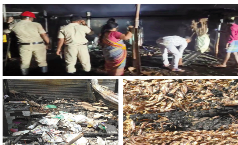
అక్కడికి చేరుకుని మంటలు అదుపులోకి తెచ్చారు.

నెల్లూరు జూన్ 01(తరణం బ్యూరో )గూడూరు పట్టణంలోని ఐసిఎస్ రోడ్డులో తాత్కాలిక చేపల మార్కెట్లో అగ్ని ప్రమాదం జరిగింది. ఈ ప్రమాదంలో సుమారు 7 లక్షల రూపాయ మేర నష్టం వాటిల్లినట్లు బాధితులు వాపోయారు.గూడూరు పట్టణంలోని ఐసిఎస్ రోడ్డులో తాత్కాలికంగా ఉన్న చేపల మార్కెట్లో శుక్రవారం రాత్రి అగ్ని ప్రమాదం జరిగింది. మార్కెట్ లోని ఓ దుకాణంలో షార్ట్ సర్క్యూట్ కారణంగా మంటలు చెలరేగాయి.వేసవి కాలం కావడంతో పక్క దుకాణాలకు కూడా మంటలు వ్యాపించాయి.ఈ మంటల్లో నాలుగు దుకాణాలు పూర్తిగా అగ్నికి ఆహుతయ్యాయి. దుకాణాల్లో ఉన్న చేపలు కాలిపోవడంతో సుమారు ఏడు లక్షల రూపాయల నష్టం వాటిల్లిందని బాధితులు వాపోయారు. సంఘటన తరువాత అగ్నిమాపక సిబ్బంది