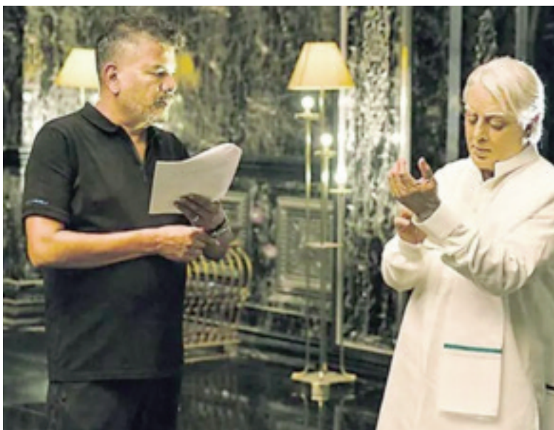
చేసేందుకు సిద్ధమైంది. ఇది విడుదలైన వెంటనే మూడో భాగానికి సంబంధించిన నిర్మాణంతర పనుల్ని మొదలు పెట్టనున్నారు.

ఇంటర్వెల్ డెన్స్: మే 16 (తరణం బ్యూరో)కమల్ హాసన్ హీరోగా శంకర్ దర్శకత్వంలో తెరకెక్కుతోన్న చిత్రం 'భారతీయుడు 2' వీళ్లిద్దరి కాంబినేషన్లోనే వచ్చిన హిట్ సినిమా 'భారతీయుడు'కు సీక్వెల్గా ఇది రానుంది.తాజాగా దీనికి సంబంధించిన కొన్ని అప్డేట్స్ సోషల్ మీడియాలో వైరల్గా మారాయి. మూడో భాగంపై కూడా వార్తలు వస్తుండడంతో సినీ ప్రియులు సంబర పడుతున్నారు.'భారతీయుడు 2'తో పాటే మూడో భాగాన్ని కూడా సిద్ధం చేస్తున్నట్లు టీమ్ ఇప్పటికే ప్రకటించిన సంగతి తెలిసిందే. పార్ట్ 3కు (సంబంధించిన ఘాటంగీసు కూడా శంకర్ %) కంప్లీట్ చేసినట్లు వార్తలు వస్తున్నాయి. ఈ రెండు సినీమాలను ఏడాదిలోపే విడుదల చేయాలని చిత్రబృందం భావిస్తున్నట్లు సమాచారం. 'భారతీయుడు 2' ట్రైలర్ రిలీజ్ కోసం యూనిట్ ఓ భారీ ఈవెంట్ను ప్లాన్ చేస్తోందట. ఇప్పటికే పనులు పూర్తయినట్లు టాక్. జూన్లో సినీమాను ప్రేక్షకుల ముందుకు తీసుకు రానున్నట్లు చిత్రబృందం గతంలోనే తెలిపింది. జూన్కు పోస్ట్ ప్రొడక్షన్ పనులు కష్టమని అందుకే దీన్ని జూలై 12కు వాయిదా వేసినట్లు టాక్ వినిపిస్తుంది. అన్నిటికంటే ముఖ్యంగా ఈ మూవీ టీమ్ భారీ సర్ప్రైజ్కు ప్లాన్ చేసినట్లు తెలుస్తోంది. పార్ట్-3 వైమాక్స్లోనే మూడో భాగం ట్రైలర్ను ప్రదర్శించాలని చూస్తోందట. దానితో పాటే పార్ట్-3 విడుదల తేదీని కూడా ప్రకటించనున్నట్లు తెలుస్తోంది.గాయంతోనే కేన్స్కు బళ్ళర్యరాయ్.. వీడియో వైరల్1996లో శంకర్ దర్శకత్వంలో వచ్చి సంచలనం సృష్టించింది 'భారతీయుడు'. సేనాపతి పాత్రలో కమల్ (%ఖుషి అ%) అహార్యం, హావభావాలు ప్రేక్షకుల్ని విశేషంగా ఆకట్టుకున్నాయి. ఈ చిత్రానికి సీక్వెల్గా 'భారతీయుడు 2' మరోసారి మ్యూజిక్