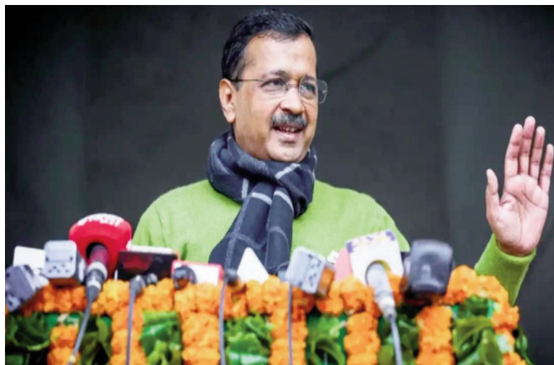
ఎన్నికల్లో కర్ణాటకలో బీజేపీ, జేడీ(ఎస్) కలిసి పోటీ చేస్తున్న సంగతి తెలిసిందే. ఇక మధ్యం కుంభకోణం కేసులో మనీ లాండరింగ్ వ్యవహారంలో ఢిల్లీ సీఎం కేజ్రీవాల్ ను ఈడీ ఆరెస్ట్ చేసింది. అయితే సార్వత్రిక ఎన్నికల నేపథ్యంలో తనకు బెయిల్ మంజూరు చేయాలంటూ ఆయన సుప్రీంకోర్టును ఆశ్రయించారు. ఈ నేపథ్యంలో కేజ్రీవాల్ కు సుప్రీంకోర్టు మధ్యంతర బెయిల్ మంజూరు చేసింది. అయితే జూన్ 2వ తేదీన లోగిపోవాల్సి ఉంటుందని తన జారీ చేసిన మధ్యంతర బెయిల్ ఉత్తర్వుల్లో సుప్రీంకోర్టు స్పష్టం చేసింది.

లఖ్నో: మే 16: (తరణం బ్యూరో) సార్వత్రిక ఎన్నికల్లో ఇండియా కూటమికి మద్దతు ఇవ్వాలని ఉత్తరప్రదేశ్ ప్రజలకు ఆమ్ కన్వీనర్, ఢిల్లీ సీఎం అరవింద్ కేజ్రీవాల్ విజ్ఞప్తి చేశారు. గురువారం లఖ్నోలోని ఏర్నాటు చేసిన విలేకర్ల సమావేశంలో కేజ్రీవాల్తోపాటు సమాజ్వాదీ పార్టీ అధినేత అఖిలేష్ యాదవ్, ఆమ్ నేత సంజయ్ సింగ్ పాల్గొన్నారు. ఈ సందర్భంగా కేజ్రీవాల్ మాట్లాడుతూ.. కేంద్ర హోం శాఖ మంత్రి అమిత్ షాను ప్రధాన మంత్రిని చేసేందుకు నరేంద్ర మోదీ ఓట్లు అడుగుతున్నారని ఆరోపించారు. మళ్లీ బీజేపీ అధికారంలోకి వస్తే.. రానున్న మూడు నెలల్లో యూపీ సీఎం యోగి ఆదిత్యనాథ్ ను ఆ పదవి నుంచి తొలగిస్తారన్నారు. అలాగే షెడ్యూల్ కులాలు, షెడ్యూల తెగలకు రాజ్యాంగం కల్పించిన రిజర్వేషన్లు తొలగిస్తారని స్పష్టం చేశారు. జూన్ 4వ తేదీన అంటే.. సార్వత్రిక ఎన్నికల ఓట్ల లెక్కింపు ప్రారంభమవుతుందని.. అనంతరం ఇండియా కూటమి అధికారంలోకి వస్తుందని కేజ్రీవాల్ ధీమా వ్యక్తం చేశారు. అయితే ఆమ్ అడ్మినిస్ట్రేషన్ రాజ్యసభ సభ్యులైన స్వాతి మలివాల్ పై దాడి ఘటనపై స్పందించాలని విలేకర్లు కోరగా.. ఎస్సీ నేత అఖిలేష్ యాదవ్ నిరాకరించారు. కానీ విలేకర్ల అడిగిన ప్రశ్నపై ఆమ్ ఎంపీ సంజయ్ సింగ్ స్పందించారు. దేశంలో చాలా ఘటనలు చోటు చేసుకుంటున్నాయన్నారు. వాటిపై ప్రధాని మోదీ స్పందించడం లేదన్నారు. అందులో మజిలీలో జరిగిన హింస కూడా ఉందన్నారు. అలాగే హాసన్ ఎంపీ, జేడీ(ఎస్) నేత ప్రజ్ఞల్ రేవణ్ణ అంశంపై కూడా ప్రధాని మోదీ మాట్లాడలేదని సంజయ్ సింగ్ గుర్తు చేశారు. అయితే ప్రజ్ఞల్ రేవణ్ణకు ఓటు వేయాలని ప్రధాని మోదీ కర్ణాటక ప్రజలకు విజ్ఞప్తి చేస్తున్నారన్నారు. ప్రస్తుతం జరుగుతున్న సార్వత్రిక