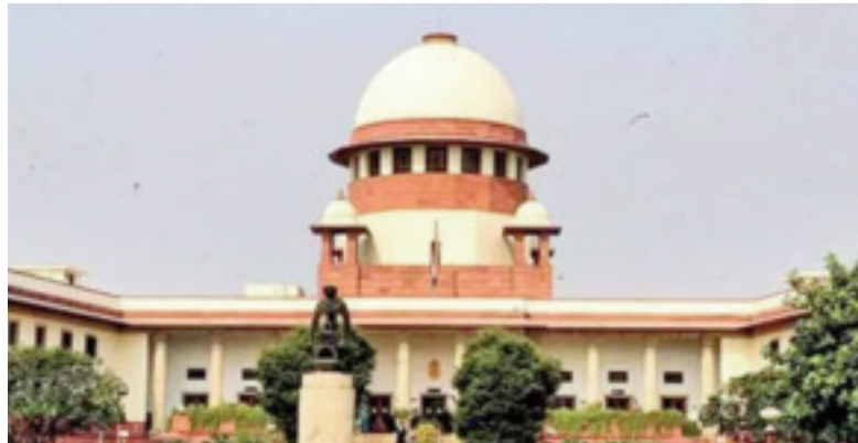
వెల్లడించింది మనీలాండరింగ్ కేసుల్లో ఈడీ స్వాధీనం చేసుకున్న మెటేరియల్ ఆధారంగా ఓ వ్యక్తి నేరానికి పాల్పడ్డాడని దర్యాప్తు సంస్థ విశ్వసితే అప్పుడు సెక్షన్ 19 కింద నిందితుడిని ఆరెస్టు చేసే అధికారం ఉంటుంది. అయితే, ఆరెస్టుకు గల కారణాలను ఈడీ సదరు వ్యక్తికి వీలైతే తన త్వరగా తెలియజేయాల్సి ఉంటుంది

దిల్లీ: మే 16. (తరణం బ్యూరో) మనీలాండరింగ్ కేసు లో ఎన్ఫోర్స్ మెంట్ డైరెక్టరేట్ ఆరెస్టు ప్రక్రియకు సంబంధించి సుప్రీం కోర్టు గురువారం కీలక ఉత్తర్వులు వెలువరించింది. మనీలాండరింగ్ ఫిర్యాదుపై ప్రత్యేక కోర్టు విచారణకు స్వీకరించిన తర్వాత ఆ కేసులో నిందితుడిని ఈడీ అధికారులు ఆరెస్టు చేయకూడదని వెల్లడించింది. ఒకవేళ నడరు నిందితుడిని కస్టడీలోకి తీసుకోవాలంటే దర్యాప్తు సంస్థ (ప్రత్యేక కోర్టు అనుమతి తీసుకోవాల్సిందేనని స్పష్టం చేసింది. “సీఎంఎల్ఏ చట్టం సెక్షన్ 44 కింద దాఖలైన మనీలాండరింగ్ ఫిర్యాదులను ప్రత్యేక కోర్టు విచారణకు స్వీకరిస్తే గనుక.. ఆ కేసుల్లో నిందితుడిగా చూపించిన వ్యక్తిని సెక్షన్ 19 కింద ఆరెస్టు చేసే అధికారం ఈడీకి ఉండదు. ఈ కేసులో ప్రత్యేక కోర్టు జారీ చేసిన సమస్యకు నిందితుడు న్యాయస్థానం ఎదుట హాజరైతే దాన్ని కస్టడీలో ఉన్నట్లుగా పరిగణించకూడదు. ఒకవేళ తదుపరి విచారణ కోసం ఆ వ్యక్తిని ఈడీ కస్టడీకి తీసుకోవాలనుకుంటే.. అప్పుడు దర్యాప్తు సంస్థ ప్రత్యేక కోర్టులో దరఖాస్తు చేసుకోవాలి. దీనిపై న్యాయస్థానం విచారణ జరుపుతుంది. ఈడీ కారణాలతో కోర్టు సంక్లిప్తీ చెందితేనే కస్టోడియన్ విచారణకు అనుమతినిస్తుంది” అని సుప్రీంకోర్టు ధర్యాసనం