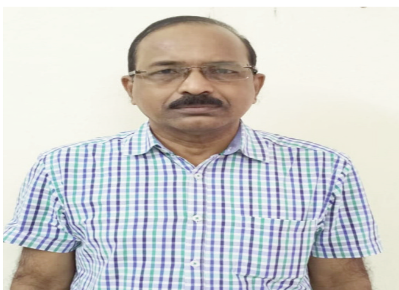
ప్రత్యేకంగా పెద్దలకి టీసీజి వ్యాక్సిన్ వేయబడును, ఈ కార్యక్రమాన్ని ప్రజలందరూ వినియోగించుకొని టీబీ రహిత భారత దేశంలో భాగస్వాములు కావాలని జిల్లా వైద్య ఆరోగ్య శాఖ అధికారులు పిలుపునిచ్చారు.