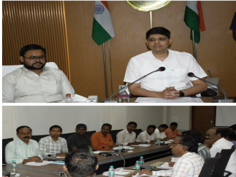
శ్రీనివాస్, ఇతర జిల్లా అధికారులు, ఇంజనీరింగ్, మున్సిపల్ శాఖల అధికారులు, మండల విద్యాశాఖ అధికారులు, తదితరులు పాల్గొన్నారు.

నిర్మల్ మే15(తరణం బ్యూరో )నిర్మల్ జిల్లాలో నాణ్యతా ప్రమాణాలతో అమ్మఆదర్శ పాఠశాల పనులను చేపట్టాలని కలెక్టర్ ఆశిష్ సాంగ్వాన్ అధికారులను ఆదేశించారు.బుధవారం కలెక్టరేట్ సమావేశ మందిరంలో అమ్మ ఆదర్శ పాఠశాలల పనులపై సంబంధిత శాఖల అధికారులతో ఆయన సమీక్షా సమావేశం నిర్వహించారు. ఈ సందర్భంగా కలెక్టర్ మాట్లాడుతూ అమ్మఆదర్శ పాఠశాల పనులలో నాణ్యత ప్రమాణాలు పాటించాలని సూచించారు. జూన్ 5 లోగా పనులను పూర్తి చేసేలా కార్యాచరణ రూపొందించాలని ఆదేశించారు. అమ్మఆదర్శ పాఠశాల కార్యక్రమంలో భాగంగా ప్రభుత్వ పాఠశాలలు, కేజీబీవీ లలో త్రాగునీరు, మరుగుదొడ్ల నిర్మాణం, మరుగుదొడ్లకు, నీటి సదుపాయం, కాంపౌండ్ వాల్ రిపేర్లు, విద్యుత్ పనులు, స్లాబ్ ల మరమ్మత్తులు, గ్రీన్స్ ఏర్పాటు, పెయింటింగ్స్ వంటి పనులు, మరమ్మత్తులు చేపట్టాలని ఆదేశించారు. పనుల ప్రారంభం ముందు, తర్వాత ఫోటోలతో కూడిన నివేదికలను సమర్పించాలని సూచించారు. అధికారులు సమన్వయంతో పనిచేసి నిర్దేశించిన గడువులోగా పనుల పూర్తికి చర్యలు తీసుకోవాలని సూచించారు. అనంతరం పాఠశాలల వారీగా చేపట్టిన పనులు, మరమ్మత్తులకు సంబంధించిన వివరాలను మండలాల వారీగా సమీక్షించారు. ఈ సమావేశంలో అదనపు కలెక్టర్ పైజాన్ అహ్మద్, డీఈవో రవీందర్ రెడ్డి, డిఆర్ఓ విజయలక్ష్మి, డిపిఓ