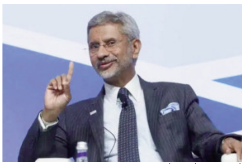
సైనికులను మోహరించింది. ఓ పక్క కొవిడ్ను ఎదుర్కొంటూనే మన దేశం సరిహద్దుల్లో మోహరింపులు జరిపింది. దేశం మన సైన్యానికి మద్దతుగా ఉండాలి. మీ సైనికులను, ప్రజలను తక్కువ చేయడం బాధాకరం” అని వెల్లడించారు. భారత్కు ఐరాన భద్రతా మండలిలో శాశ్వత సభ్యత్వం వచ్చే విషయంపై జైశంకర్ ఆశాభావంగా ఉన్నట్లు వెల్లడించారు. దానిపై చర్చలు ఊపందుకొన్నాయని చెప్పారు. ఐరాసలో సంస్కరణలకు ప్రపంచ దేశాలు అనుకూలంగా ఉన్నాయి. భారత అభ్యర్థిత్వానికి మద్దతునిస్తున్నాయని అన్నారు.

జైశంకర్ ఇంటర్నెట్ డెస్క్: మే 13. (తరణం బ్యూరో)నిజ్జర్ హత్యకేసుకు సంబంధించి పనికొచ్చే సమాచారం ఏదీ భారత్ చేతికి అందలేదని విదేశాంగ శాఖ మంత్రి ఎస్ జైశంకర్ పేర్కొన్నారు.ఈ కేసుకు సంబంధించి కెనడా ప్రభుత్వం నాలుగో అరెస్టు చేయడంపై సోమవారం ఆయన విలేజర్ల సమావేశంలో స్పందించారు. నిజ్జర్ హత్యపై కెనడా నుంచి ఎటువంటి విలువైన సమాచారం అందినా భారత్ కచ్చితంగా దానిపై దర్యాప్తు చేసేదన్నారు. “అసలు మాకు ఇంత వరకు ఏ సమాచారం అందలేదు. ఆ కేసుకు సంబంధించి గత కొన్ని రోజుల్లో ఏ కీలక పరిణామాలు చోటు చేసుకొన్నాయో నాకు తెలియదు. సాధారణంగా విదేశీయులను అరెస్టు చేస్తే కాన్సులర్ విధానాల్లో భాగంగా ఆ దేశ దౌత్య కార్యాలయానికి సమాచారం అందించాలి. వాస్తవానికి భారత్-కెనడా మధ్య చర్చలు జరిగాయి. మీరు వేర్కొంటున్నామని, నేరగాళ్లు, ఉగ్రవాదులకు ఆశ్రయం కల్పిస్తున్నారని చెప్పాం. వారిలో చాలా మందిని భారత్కు అప్పగించాలని కోరాం. మా దౌత్యవేత్తలకు పొంచి ఉన్న ముప్పుపై వారి వద్ద పలుమార్లు అందోళన వ్యక్తం చేశాం” అని జై శంకర్ పేర్కొన్నారు. సరిహద్దు వివాదానికి నెహ్రూనే కారణం..నెహ్రూ వైఖరి కారణంగా చైనాతో తలెత్తిన సరిహద్దు వివాదానికి.. కాంగ్రెస్ మోదీని నిందిస్తోందని జైశంకర్ పేర్కొన్నారు. “భారత్ నుంచి 1958-62 మధ్యలో చైనా చాలా భూమిని లాక్కొంది. కానీ, కాంగ్రెస్ వారు మాట్లాడే సమయంలో తప్పు దోప పట్టించేలా చైనా భూమి ఆక్రమించిందనే చెబుతారు.. కానీ, అది 1962లో లాక్కొన్న భూమి అని వెల్లడించారు. వారి తప్పు లేదన్నట్లే ఉంటారు. చైనా వైపు నుంచి సవాళ్లున్నాయి. ఆ దేశం ఒప్పందాలను ఉల్లంఘిస్తోంది. సరిహద్దుల్లో భారీగా