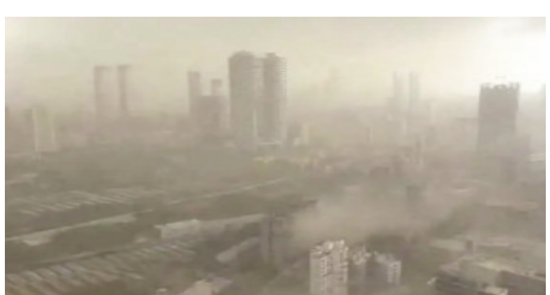
నెలకొరిగాయి. దీంతో పలు మార్గాల్లో మెట్రో సేవలు తాత్కాలికంగా నిలిపివేశారు. సబ్ అర్బన్ రైళ్లకూ అంతరాయం ఏర్పడింది. అనేక చోట్ల విద్యుత్తును నిలిపివేశారు.

ఇంటర్నెట్ డెస్క్: మే 13. (తరణం బ్యూరో) కొన్నిరోజులుగా వేడితో సతమతమవుతోన్న ముంబయిని ఈ సీజన్లో తొలి వర్షం పలకరించింది. అయితే, నగరంలో పలు ప్రాంతాల్లో అకాల వర్షంతోపాటు ఈదురుగాలులు బీభత్సం సృష్టించాయి.కొన్నిచోట్ల తీవ్ర స్థాయిలో దుమ్ముచేగింది. బలమైన గాలులకు హెర్డింగులు విరిగిపడ్డాయి. కొన్నిచోట్ల వైర్లు తెగిపడ్డాయి. దీంతో మెట్రోతోపాటు లోకల్ రైలు సర్వీసులకు అంతరాయం కలిగింది. రాణి, పాల్వర్, ముంబయి ప్రాంతాల్లో ఉరుములతో కూడిన వర్షం కురిసే అవకాశం ఉందని వాతావరణ శాఖ హెచ్చరించింది.దాదర్, కుర్లా, మాహిమ్, ఘాట్కోపర్, ములుండ్, విఠోలితోపాటు దక్షిణ ముంబయిలో కొన్ని ప్రాంతాల్లో సోమవారం సాయంత్రం తేలికపాటి వర్షంతోపాటు, బలమైన గాలులు వీచాయి. కొన్నిచోట్ల దట్టమైన దుమ్ము ఎగిసిపడింది. భవనాలపై ఉన్న హెర్డింగులు కూలిపోయాయి. అనేక ప్రాంతాల్లో స్తంభాలు, చెట్లు