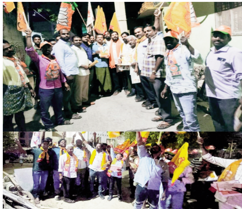
ఉంచుకొని ఉమ్మడి అభ్యర్థులను గెలిపించాలని ప్రతి ఇంటికీ వెళ్లి కరపత్రాలను అందజేసి విజ్ఞప్తి చేశారు.