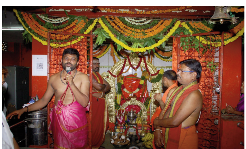
జయంతి సందర్భంగా పట్టణంలో గల హనుమాన్ ఆలయాలు భక్తులతో కిటకిటలాడాయి మంగళవారం సాయంత్రం హనుమాన్ పల్లకి సేవా పట్టణంలో ఊరేగింపు నిర్వహించారు