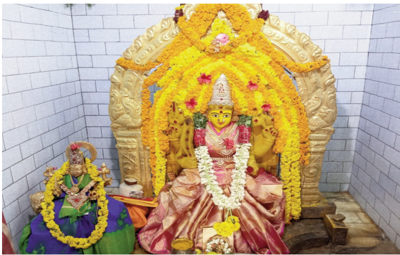
మహాదాశీర్వచనము, మధ్యాహ్నం అన్నదాన మహోత్సవము, రాత్రి అమ్మవారి "గ్రామోత్సవము28న ఆదివారం ఉదయం 8 గంటలకు బోజాల తిరుణాల కార్యక్రమాలు నిర్వహిస్తున్నట్లు వారు తెలిపారు