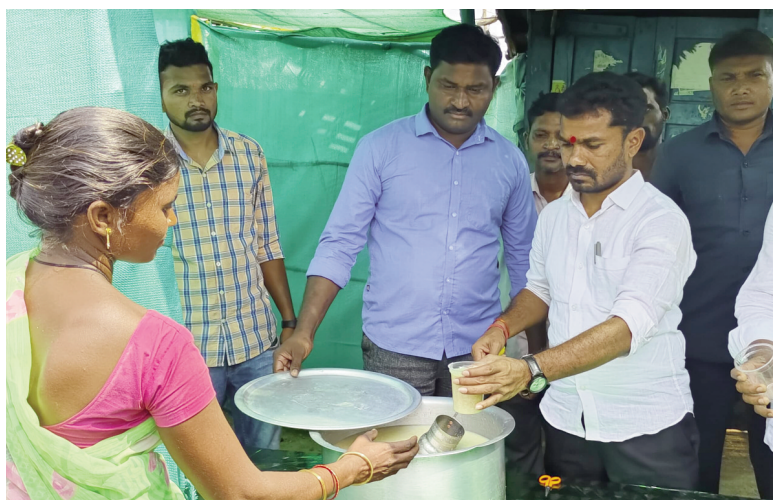
ఖానాపూర్ (కడ0ఏప్రిల్ 23(తరణం బ్యూరో ) ప్రతి ఏటా నిర్వహించే ఉచిత అంబులి కేంద్రాన్ని ఖానాపూర్ ఎమ్మెల్యే భోజనం పటేల్ ప్రారంభించారు కడం మండలంలోని నచ్చన్ ఎల్లాపూర్ గ్రామంలో బొడ్డు గంగన్న ఆధ్వర్యంలో నిర్వహిస్తున్న ఉచిత అంబులి కేంద్రాన్ని ప్రజలకు అంబులిని పంపిణీ చేశారు. ఈ సందర్భంగా ఎమ్మెల్యే మూట్టాడుతూ వేసవి కాలంలో అంబులి కేంద్రాలను ఏర్పాటు చేసి ప్రజలకు ఉచితంగా అందించడం అభినందనీయమన్నారు. ప్రజలు ఈ అంబులి కేంద్రాన్ని సద్వినియోగం చేసుకోవాలన్నారు. ఈ కార్యక్రమంలో కాంగ్రెస్ పార్టీ నాయకులు, గ్రామస్థులు తదితరులు పాల్గొన్నారు.