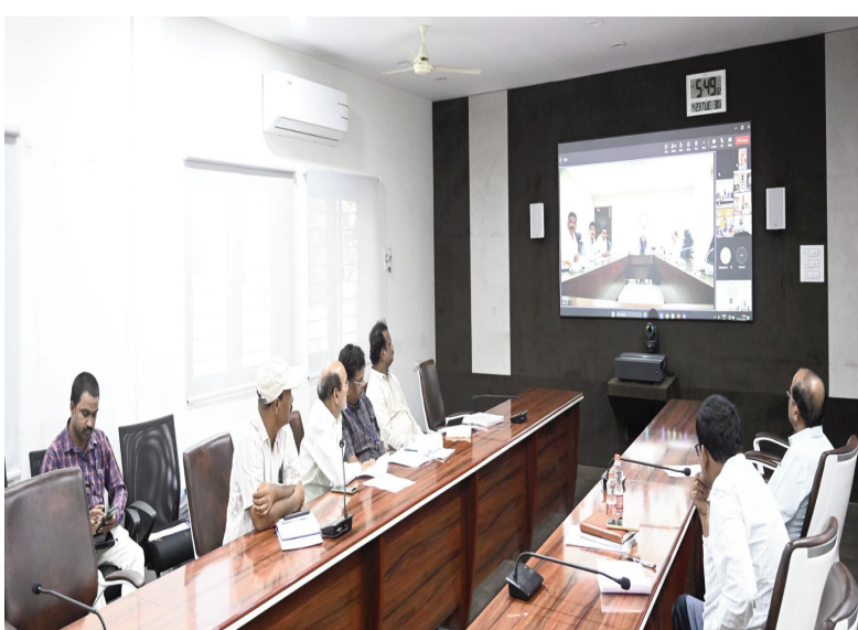
జిల్లాలో మొత్తం 5450 హ్యాబిటేషన్స్ ఉన్నాయని ప్రస్తుతం 80 హ్యాబిటేషన్స్ ట్యాంకర్ల ద్వారా నీటి సరఫరా చేయడం జరుగుతోందని నీటి సమస్య పై యుద్ధ ప్రాతిపదికన చర్యలు చేపట్టాలన్నారు. గ్రామపంచాయతీలు, హ్యాబిటేషన్లు మరియు మున్సిపాలిటీ పరిధిలో త్రాగునీటికి ఇబ్బందులు లేకుండా ఎంపీడిఎల్, మున్సిపల్ కమిషనర్లు, ప్రతిరోజు పర్యవేక్షణ చేయాలన్నారు. ఏప్రిల్, మే, జూన్, ఈ మూడు నెలలు క్షేత్రస్థాయిలో త్రాగునీటి సమస్య రాకుండా అధికారులు యాక్టివ్ గా ఉండాలన్నారు.జిల్లాలోని త్రాగునీటి పథకాలను పరిశీలించి వీటి ద్వారా ప్రజలకు నీటి సరఫరా చేయాలన్నారు.ప్రజలు నీటి సమస్య పరిష్కారానికి ఆర్థికంగా ఎస్ అధికారి కార్యాలయంలో ఏర్పాటు చేసిన కంట్రోల్ రూమ్ నెంబర్ 9032430230 కి ఫోన్ చేసి నీటి సమస్య పరిష్కరించుకోవాలన్నారు.వేసవిలో విద్యుత్ సమస్య తలెత్తకుండా చూడాలని ఏపీఎస్సీడిసీఎల్ అధికారులను ఆదేశించారు.మహాత్మా గాంధీ జాతీయ గ్రామీణ ఉపాధి హామీ పథకం ద్వారా అర్హులైన పేదలందరికీ జాబ్ కార్డులు మంజూరు చేసి పని కల్పించాలన్నారు. ఈ పథకం ద్వారా గ్రామీణ ప్రాంతంలోని ప్రజలకు మెరుగైన జీవనోపాధి కల్పించే విధంగా అధికారులు కృషి చేయాలని పనిచేసే ప్రాంతంలో కూలీలకు ప్రభుత్వ నియమ నిబంధన ప్రకారం నీరు, సేమియానా, ఫస్ట్ ఎయిడ్ బాక్స్, వంటి అన్ని వసతులు ఉండేట్లు చూడాలన్నారు.