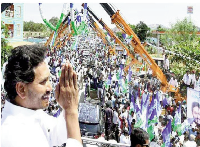
ప్రతిపక్ష పార్టీలైన టీడిపీ, బీజేపీ రెండు విభిన్న నిర్ణయం ప్రకటించాయని,ఎన్నికల కోసం పొత్తు పెట్టుకున్న ఈ రెండు పార్టీలూ స్టీల్ ప్లాంట్పై నిర్ణయాన్ని ఇంతవరకు స్పష్టం చేయకుండా రాష్ట్ర ప్రయోజనాలపై దెబ్బ కొడుతున్నాయని సీఎం జగన్ మండిపడ్డారు.'కూటమిగా ఏర్పడిన ( టీడిపీ,జనసేన, బీజేపీ) పార్టీలు స్టీల్ ప్లాంట్ విషయంలో తమ నైతికతను, విలువలు మరిచాయని ఆగ్రహం వ్యక్తం చేశారు.

(విశాఖపట్నం.ఏప్రిల్ 23, తరణం ప్రతినిధి)విశాఖ స్టీల్ ప్లాంట్ విషయంలో టీడిపీ,బీజేపీ పార్టీలు తమ వైఖరిని స్పష్టం చేయాలని ఏపీ సీఎం జగన్ చెప్పుకొచ్చారు. మంగళవారం మేముంతా సిద్ధం బసలో ఉన్న జగన్ను స్టీల్ ప్లాంట్ కార్యక సంఘాల నేతలు మర్యాద పూర్వకంగా కలుసుకుని సమస్యలు ప్రస్తావించారు.అయితే టీడిపీ, బీజేపీఎ ఎన్నికల కోసం పొత్తులని,ఈ రాష్ట్ర ప్రయోజనాలపై అవి పొలిటికల్ డ్రామాలాడుతున్నాయని జగన్ ఆరోపించారు.విశాఖ ఉక్కు కర్మాగారం ప్రైవేటీకరణకు వైసీపీ వ్యతిరేకమేనని తొలినుంచీ చెప్పుకొన్నారని, తామెప్పుడూ విశాఖ ఉక్కు పరిరక్షణ పోరాట సమితి కార్యక సంఘం నాయకులకు అండగా ఉంటామని జగన్ స్పష్టం చేశారు.ఇంకా సీఎం ఏమన్నారంటే...వైజాగ్ స్టీల్ ప్లాంట్ ప్రైవేటీకరణ అంశంలో ఈ రాష్ట్ర ప్రభుత్వం, వైసీపీ కార్యకులకు మద్దతుగా నిలుస్తుందని జగన్ తెలిపారు. స్టీల్ ప్లాంట్ కార్యకుల తరపున తొలుత గొంతెత్తించి ఈ ప్రభుత్వం,వైసీపీయేనన్నారు. అదే విధంగా స్టీల్ ప్లాంట్ ప్రైవేటీకరణ సమస్యకు పరిష్కారాలను ప్రతిపాదిస్తూ తమ ప్రభుత్వమే ప్రధానికీ లేఖ రాసిందని గుర్తు చేశారు. స్టీల్ ప్లాంట్ ప్రైవేటీకరణను వ్యతిరేకిస్తూ అసెంబ్లీలో తీర్మానం కూడా చేశామని, ఈ విషయంలో ఈ రాష్ట్ర ప్రభుత్వం,వైసీపీదీ రాజీలేని ధోరణి అని జగన్ స్పష్టం చేశారు.ఇనుప ఖనిజం గనుల్ని శాస్త్రతంగా కేటాయించడం వల్ల ప్లాంట్ పరిస్థితి మెరుగుపడు తుందని,విశాఖ స్టీల్ ప్లాంట్ పునరుద్ధరణకు తాము శక్తివంతమైన లేకుండా శ్రమిస్తున్నామని,కేంద్ర ప్రభుత్వంపై నిరంతరం ఒత్తిడి తెస్తున్నామని సీఎం జగన్ తెలిపారు.ఈ ఎన్నికల్లో వైజాగ్ స్టీల్ ప్లాంట్ కార్యకుల మద్దతును కోర్ నైతికత కేవలం వైసీపీకి మాత్రమే ఉందని,తమ పార్టీ మాత్రమే కార్యకు లకు అండగా నిలిచిందన్నారు.ఈ అంశంపై