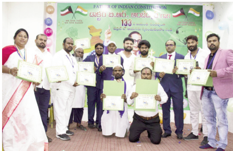
కార్యక్రమాన్ని జయప్రదం చేసిన భారతీయులందరికీ ముఖ్యంగా తెలుగు ప్రజలందరికీ ధన్యవాదాలు తెలిపారు