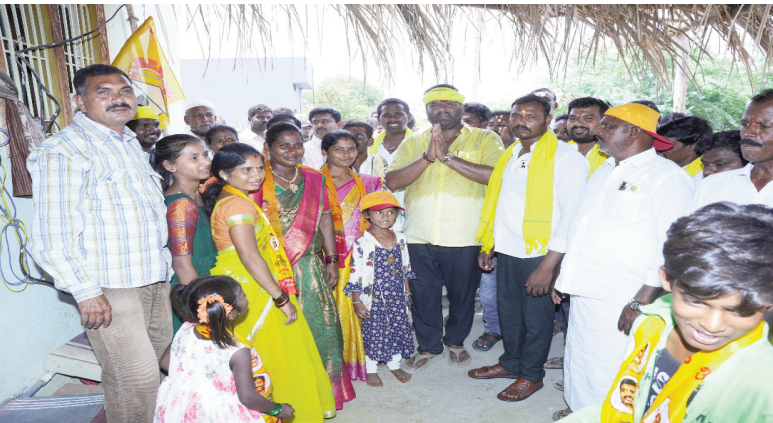
అన్నమయ్య ఏప్రిల్ 12( తరణం బ్యూరో)అన్నమయ్య జిల్లా కేంద్రంరాయచోటి

కదం తొక్కిన పాత రాయచోటి 32,33 వార్డులప్రజలు మండిపల్లి,సుగవాసి కుటుంబాల కలయికతో పాత రాయచోటి 32,33 వార్డులలో భారీ స్పందన అభిమానంతో జై మండిపల్లి జై సుగవాసి అంటూ నినాదాలు మండుటెండలకు సైతం రాముడు వెంట నడిచిన కార్యకర్తలు. పాత రాయచోటి టిడిపికి కంచుకోట అని నిరూపిస్తూ కదం తొక్కిన ప్రజలు "" వైసిపి నియంతల హుకుని లెక్కచేయని పాత రాయచోటి ప్రజలు