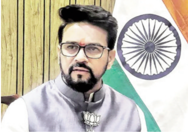
తీరప్రాంతం ఉన్న ఆంధ్రప్రదేశ్లో అదృశ్యమైన సృష్టించేందుకు ఉన్న అవకాశాలను వైకాపా ప్రభుత్వం ఉపయోగించుకోలేకపోయింది. రూ.వేల కోట్ల అప్పులు చేసి ఏపీని పూర్తిగా అప్పుల ఊబిలోకి తోసింది. అప్పులకు కేంద్రాన్ని బాధ్యుల్ని చేయలేరు. కొవిడ్ సమయంలో అన్ని రాష్ట్రాలకూ అప్పుల పరిధిని 3% నుంచి 3.5%కి పెంచాం. వివిధ షరతులకు లోబడి అదనపు రుణాలు తీసుకోవడానికి అన్ని రాష్ట్రాలకూ కేంద్రం అవకాశం ఇచ్చింది. సంస్కరణల ఆధారంగా ప్రోత్సాహకాలు అందించింది. అంతే తప్ప ఆంధ్రప్రదేశ్కు ప్రత్యేక వెసులుబాట్లు కల్పించలేదు" అని తెలిపారు.

దిల్లీ: 'ఏప్రిల్ 04 (తరణం బ్యూరో)ఆంధ్రప్రదేశ్ అభివృద్ధి కోసమే భాజపా, తెదేపా, జనసేనలు కూటమిగా ఏర్పడ్డాయి. రాష్ట్ర అభివృద్ధి కోసం ఎన్నియే కూటమికి ఓటేయాలని పిలుపునిస్తున్నా' అని కేంద్ర సమాచార, ప్రసార శాఖల మంత్రి అనురాగ్ సింగ్ రాకుర్ పేర్కొన్నారు.లోక్సభ ఎన్నికల నేపథ్యంలో ఆయన బుధవారం దిల్లీలోని తన నివాసంలో ప్రాంతీయ పత్రికల మీడియా ప్రతినిధులతో మాట్లాడారు. 'ప్రత్యేక హోదాకు సమానమైన మొత్తం సాయం చేస్తామని ఇదివరకే చెప్పాం. ఆంధ్రప్రదేశ్ను ఏ విషయంలోనూ నిర్లక్ష్యం చేయలేదు. దేశంలో మూడు రాష్ట్రాలకు బల్లెడ్రగ్ పార్కులు కేటాయిస్తే అందులో ఒకటి ఆంధ్రప్రదేశ్కు ఇచ్చాం. నాలుగింటిలో ఒక మెడికల్ డివైజ్ పార్కునూ ఇచ్చాం. విభజన చట్టంలో పేర్కొన్న విద్యాసంస్థల్ని మంజూరు చేసి నిర్మించాం. పోలవరం ప్రాజెక్టుకు రాష్ట్ర ప్రభుత్వం అడిగిన డబ్బులన్నీ ఇచ్చాం. వై.ఎస్.షర్మల కాంగ్రెస్లో చేరడం ఆమె వ్యక్తిగత నిర్ణయం. భాజపాలోకి చేరాలని ఎవరిపైనా ఒత్తిడి తేదడం లేదు" అని అనురాగ్ రాకుర్ పేర్కొన్నారు.ఏపీ ప్రజలు ప్రత్యామ్నాయం కోరుకుంటున్నారు..‘చూజీ ప్రధాని అటల్ బిహారీ వాజ్పేయీ సమయం నుంచి ప్రస్తుత ప్రధాని మోదీ వరకు చంద్రబాబునాయుడుతో కలిసి పనిచేసిన అనుభవం ఉంది. కూటమి రెండుసార్లు కేంద్రంలో, రాష్ట్రంలో ప్రభుత్వాలు ఏర్పాటు చేసింది. ఆంధ్రప్రదేశ్లో భాజపాతో పాటు లేకపోతే కూటమి అసంపూర్తిగా ఉంటుందని, కలిసి పోటీ చేస్తే మరింత శక్తిమంతంగా తయారవుతుందని చంద్రబాబునాయుడు, పవన్కల్యాణ్ భావించి ఉండొచ్చు. ప్రస్తుతం ఆంధ్రప్రదేశ్ ప్రజలు జగన్ ప్రభుత్వానికి ప్రత్యామ్నాయాన్ని కోరుకుంటున్నారు. రాష్ట్రంలో నిర్వాణాత్మకమైన మౌలిక వసతులు కల్పించలేదు. పరిశ్రమలూ తీసుకురాలేదు. గుజరాత్ తర్వాత సుదీర్ఘ