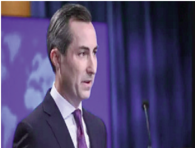
ఖలిస్తాన్ ఉగ్రవాది గురుపత్వంత్ సింగ్ పన్నూ హత్యకు కుట్ర కేసులో భారత్ అంతర్గత దర్యాప్తు నివేదికపై మిల్లర్ స్పందించారు. ఆ వివరాలను తాను వెల్లడించలేనన్నారు. ఇక భారత్ వైపు నుంచి జరిగిన దర్యాప్తు ఫలితం కోసం వేచి చూస్తున్నామన్నారు. “మీడియా రిపోర్టులపై నేను స్పందించను. భారత్ను పూర్తిస్థాయి దర్యాప్తు చేయాలని కోరాం. దాని ఫలితాల కోసం చూస్తున్నాం. ఇంతకు మించి మీకు చెప్పేందుకు ఏమీ లేదు” అని పేర్కొన్నారు.

ఇంటర్నెట్: ఏప్రిల్ 04 (తరణం బ్యూరో)దిల్లీ ముఖ్యమంత్రి అరవింద్ కేజ్రీవాల్కు అనుకూల వైఖరి తీసుకొందన్న విమర్శలకు అమెరికా విదేశాంగ శాఖ ప్రతినిధి మాధ్యమిల్లర్ వివరణ ఇచ్చారు.తాము ఎవరికీ అనుకూలం కాదని.. ప్రతి ఒక్కరిని చట్టప్రకారం సమానంగా చూడాలని, మానవ హక్కుల విషయంలోనే మాట్లాడతామని పేర్కొన్నారు. మాధ్యమిల్లర్ దిల్లీ సీఎం కేజ్రీవాల్ విషయంలో మాట్లాడతారు గానీ, పాక్లో ప్రతిపక్ష నేతల అరెస్టులపై మాత్రం మౌనంగా ఉంటారనే విమర్శలేచ్చాయి. ఈ విషయాన్ని ఓ జర్నలిస్టు బుధవారం నేరుగా ఆయన వద్దే ప్రస్తావించారు. దీనికి స్పందిస్తూ “నేను దానిని అంగీకరించను. పాకిస్తాన్లో ప్రతి ఒక్కరిని చట్ట ప్రకారమే చూడాలని, వారి మానవహక్కులను గౌరవించాలని పలు మార్లు చెప్పాము. అదే వైఖరిని ప్రపంచంలోని అన్ని దేశాల విషయంలో అనుసరిస్తాం” అని వివరణ ఇచ్చారు. మార్చి 21వ తేదీన కేజ్రీవాల్ను ఎన్ఫోర్స్మెంట్ డైరెక్టరేట్ అరెస్టు చేసింది. ఆ పరిణామాలపై అమెరికా విదేశాంగ శాఖ స్పందించింది. భారత్లోని ప్రతిపక్ష నేత అరెస్టుకు సంబంధించిన నివేదికలను నిశితంగా పరిశీలిస్తున్నామని, ఈ కేసులో పారదర్శక విచారణను ఆశిస్తున్నామని పేర్కొన్నారు. దీనిపై భారత్ తీవ్ర అభ్యంతరం వ్యక్తం చేసింది. ఇటీవల విదేశాంగ మంత్రి ఎస్ జైశంకర్ కూడా ఈ అంశంపై మాట్లాడుతూ “ఇది పాత చెడు అలవాటు. దేశాల మధ్య మధ్యస్థ అనేది ఉండాలి. మనవి సార్వభౌమత్వం ఉన్న దేశాలు. మనం ఒకరి అంతర్గత విషయాల్లో మరొకరు జోక్యం చేసుకోకూడదు. ఒక దేశ రాజకీయాలపై మరొకరు వ్యాఖ్యలు చేయకూడదు. అందుకే వీటిపై మా అభ్యంతరాలను ఆయా దేశాల దౌత్యవేత్తలకు బలంగా చెప్పాం” అని హితవు పలికారు.వన్నూ హత్యకు కుట్ర కేసులో ఫలితాల కోసం చూస్తున్నాం..