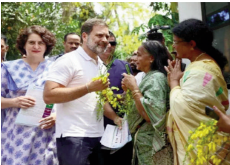
రాహుల్ గాంధీ. తనకు రూ.72లక్షల ఆస్తులు ఉన్నట్లు ప్రకటించారు. వారసత్వంగా వచ్చిన రూ.71లక్షల విలువైన ఆస్తి, రూ.10వేల నగదు, రూ.62వేల బ్యాంకు డిపాజిట్లు, రూ.25వేల విలువైన ఆభరణాలు ఉన్నాయని తెలిపారు.

వయనాడ్: ఏప్రిల్ 04 (తరణం బ్యూరో) కేరళలోని వయనాడ్ లోక్సభ స్థానం నుంచి వరుసగా రెండోసారి పోటీ చేస్తున్న కాంగ్రెస్ అగ్రనేత రాహుల్ గాంధీ బుధవారం నామినేషన్ చేసిన విషయం తెలిసిందేసోదరి ప్రియాంక గాంధీతో కలిసి ర్యాలీగా వెళ్లిన ఆయన రిటర్నింగ్ అధికారికి నామినేషన్ పత్రాలు సమర్పించారు. అందులో తన నికర సంపద రూ.20కోట్లుగా వెల్లడించారు. రూ.9.24కోట్లు చరాస్తులు, రూ.11.14 కోట్ల స్థిరాస్తులు ఉన్నట్లు పేర్కొన్నారు.చరాస్తుల్లో రూ.4.33కోట్లు బాండ్లు-షేర్ల రూపంలో, రూ.3.81కోట్లు మ్యూచువల్ ఫండ్స్లో ఉన్నాయని తెలిపారు. తన వద్ద రూ.26.25లక్షల బ్యాంకు డిపాజిట్లు, రూ. 61.52లక్షల విలువ చేసే నేషనల్ సేవింగ్స్ స్కీమ్, పోస్టల్ సేవింగ్స్, బీమా పాలీసీలు, రూ.15.21లక్షల విలువైన గోల్డ్ బాండ్లు, రూ.4.20లక్షల విలువైన ఆభరణాలు, రూ.55వేల నగదు ఉన్నట్లు వెల్లడించారు. రూ.2022-23లో తన వార్షికాదాయం రూ.కోటిగా ప్రకటించారు.స్థిరాస్తుల్లో భాగంగా దిల్లీలోని మెట్రో లీలో వ్యవసాయ భూమి ఉన్నట్లు తెలిపారు. ఇందులో సోదరి ప్రియాంక గాంధీ వాద్రాకు కూడా వాటాలున్నాయి. ఇది తమకు వారసత్వంగా దక్కిన ఆస్తిగా పేర్కొన్నారు. ఇక గురుగ్రామ్లో రూ.9కోట్ల విలువ చేసే ఆఫీస్ ఉన్నట్లు తెలిపారు. రూ.49.7లక్షల రుణాలు కూడా ఉన్నాయని ప్రకటించారు. తనపై భాజపా నేతలు ఫిర్యాదు చేసిన పరుపు నష్టం కేసులు, అసోసియేటెడ్ జర్నల్స్ లిమిటెడ్తో సంబంధం ఉన్న క్రిమినల్ కేసుల వంటి వివరాలను కూడా నామినేషన్లో వెల్లడించారు.వయనాడ్ నుంచి రాహుల్ గాంధీపై సీపీఐ తరపున అన్నీ రాజా పోటీ చేస్తున్నారు. ఆమె కూడా బుధవారమే నామినేషన్