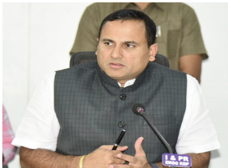
115 పరిష్కరించడం జరిగింది అని సోసియల్ మీడియా ద్వారా 11 ఫిర్యాదులు అందగా.. 9 పరిష్కరించడం జరిగింది అని అన్నారు. ఎలెక్ట్రానిక్ మీడియా ద్వారా 5 ఫిర్యాదులు అందగా.. 5 ఫిర్యాదులను పరిష్కరించడం జరిగింది అని ఆఫ్ లైన్ ద్వారా 4 ఫిర్యాదులు అందగా.. 4 పరిష్కరించడం జరిగింది అని అన్నారు. ఎఫ్.ఎస్.టి., ఎస్.ఎస్.టి., పోలీసు ఎన్ఫోర్స్మెంట్ టీమ్స్ ద్వారా చేపట్టిన సీజర్ మేనేజ్మెంట్ ప్రక్రియ ద్వారా కోడ్ అమలులోకి వచ్చినప్పటి నుండి ఇప్పటి (26-03-2024)వరకు.. జిల్లా వ్యాప్తంగా రూ.19,63,020 ల మేర నగదు, రూ.63,01,644 ల విలువైన లిక్కర్, ఇతర వస్తువుల సీజ్ చేయడం జరిగింది అని 116 ఎఫ్.ఐ.ఆర్ కేసులు నమోదు చేశామని అన్నారు.