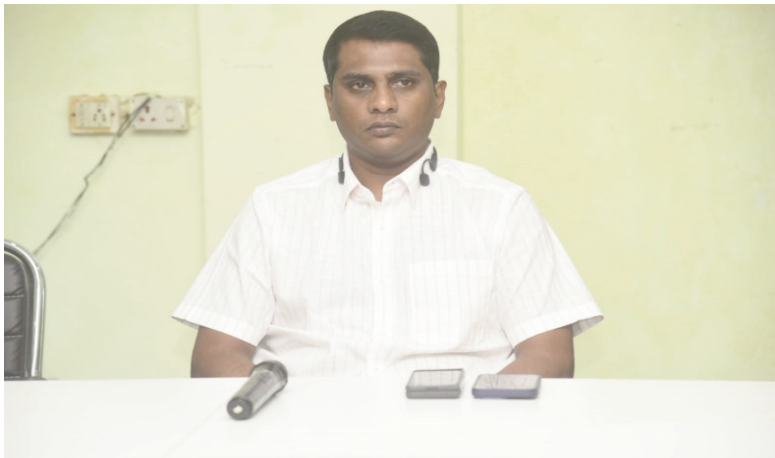
సంబంధిత అధికారులు అడిగినపుడు సమర్పించాలని, అలా చేయకపోతే ఎన్నికల నియమావళి ఉల్లంఘన కిందకు వస్తుందని ఆయన ఆ ప్రకటనలో తెలిపారు.