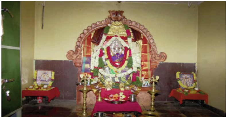
ఖానాపూర్ మార్చ్ 1(తరణం బ్యూరో) ఖానాపూర్ పట్టణంలోని ఉత్తర వాహిని గౌతమి