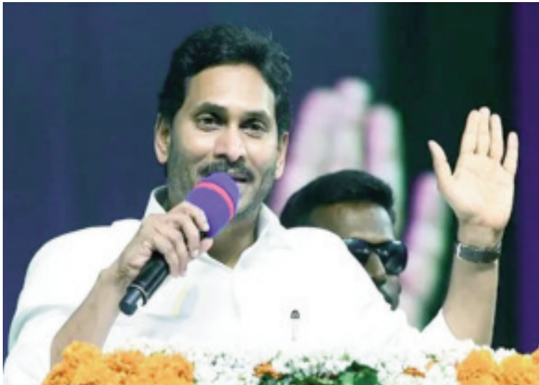
ఫీజులు కట్టిస్తున్నాం. కేవలం ఫీజులే కాకుండా వసతి దీవెన కార్యక్రమాన్ని తీసుకువచ్చి పిల్లలకు బోర్డింగ్ ఉచితంగా అందిస్తున్నాం. మేం అధికారంలోకి వచ్చిన తర్వాత 57 నెలలుగా విద్యాదీవెన, వసతి దీవెన అందిస్తున్నాం.

పామర్రలో సీఎం జగన్ కృష్ణాజిల్లా: మార్చి 01 (తరణం బ్యూరో) చదువు అనే సంపదతో ఆకాశమే హద్దుగా పేదంటి పిల్లలు ఎదగాలని, ఇందుకోసమే జగన్మాథ రథం కదులుతోందని ముఖ్యమంత్రి వైఎస్ జగన్మోహన్ రెడ్డి అన్నారు. శుక్రవారం కృష్ణా జిల్లా పామర్రలో రూ. 708.68 కోట్ల 'జగన్ నన్న విద్యా దీవెన' నిధులను బటన్ నొక్కి పిల్లలు, తల్లుల జాయింట్ ఖాతాల్లోకి సీఎం జగన్ విడుదల చేశారు. అంతకుముందు ఆయన మాట్లాడుతూ పెద్ద చదువులు చదువుకునేందుకు అవసరమైన పూర్తి డబ్బును పిల్లల తల్లులకు ఇచ్చి తల్లులే ఆ ఫీజులు కాలేజీలకు కట్టే కార్యక్రమమే విద్యాదీవెన అని తెలిపారు. రాష్ట్రంలో పెద్ద చదువులు చదువుతున్న 93 శాతం మంది పిల్లలు 9 లక్షల 44వేల 666 మందికి జగన్ నన్న ప్రభుత్వమే ఫీజులు కడుతోంది. ఏ పేదవాడు కూడా చదువుల కోసం అప్పులపాలు కాకూడదని మేం అధికారంలోకి వచ్చిన తర్వాత ఎస్సీలతో పాటు మిగిలిన కులాల వారిని స్కీమ్ కు అర్హులుగా చేసేందుకు ఆదాయపరిమితిని 2 లక్షల దాకా పెంచాం. దీంతో లబ్ధిదారుల సంఖ్య పెరిగి 93 శాతం మందికి జగన్ నన్న విద్యాదీవెన, వసతి ద్వారా మంచి చేయగలుగుతున్నాం. గతంలో ఇంత ఫీజులు కడుతాం.. ఇంత కంటే ఎక్కువ కట్టం.. మీ చావులు మీరు చావండి అన్నారు. ఈ పరిస్థితిని మారుస్తూ ప్రస్తుతం త్రైమాసికం అయిపోయిన వెంటనే ఆ మూడు నెలలకు సంబంధించిన ఫీజులు తల్లుల ఖాతాలో వేస్తూ