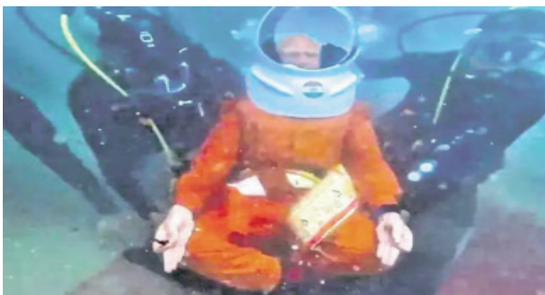
అరేబియా సముద్ర గర్భంలోని దేవ భూమి ద్వారక వద్ద పూజలు చేస్తున్న ప్రధాని మోదీ

దేవభూమి ద్వారక: ఫిబ్రవరి 26 (తరణం బ్యూరో) ప్రధాని నరేంద్రమోదీ ఆదివారం గుజరాత్ తీరంలో అరేబియా సముద్రంలో మరో సాహసకృత్యం చేశారు. నౌకాదళ దైవర్ష సాయంతో స్కూబా డైవింగ్ చేసుకుంటూ సముద్ర గర్భానికి చేరుకున్నారు. బెట్ ద్వారకా ద్వీపం వద్ద నీళ్లలో ఉన్న ప్రాచీన ద్వారక నగరాన్ని చూసి తనవలె యాత్రలు. పద్మాసనం వేసి, తన వెంట తెచ్చుకున్న నెమలి పింఛాలను శ్రీకృష్ణునికి కానుకగా సమర్పించారు. అక్కడే పూజలు చేసి, సముద్ర ఉపరితలం మీదకి తిరిగొచ్చారు. చారిత్రక ఆధారాలన్న ద్వారక నగరాన్ని చేరుకుని దైవాన్ని ప్రార్థించడం దివ్యమైన అనుభూతిని ఇచ్చిందని, ఈ ప్రయాణాన్ని సాహసయాత్రగా కంటే విశ్వాసంతో చేసినదిగా భావించాలని ఆయన పేర్కొన్నారు. ఇటీవల లక్ష్మద్వీప్ పర్యటనలో సాహసంతో స్విమ్మింగ్, స్నార్కెలింగ్ చేసిన ప్రధాని తన తాతా యాత్ర చిత్రాలను ఎక్స్ వేదికగా పంపిస్తున్నారు. దశాబ్దాల కల నెరవేరిన క్షణాలివి అధ్యాత్మిక వైభవం, అనంతమైన భక్తితో కూడిన పూజన యుగానికి కాసేపు అనుసంధానమున్నాను. శ్రీకృష్ణ భగవానుడు మనందరినీ ఆశీర్వదించారు. సముద్రగర్భ ద్వారకను చేరుకోవాలనేది నాకు దశాబ్దాల కల. ఎట్టకేలకు అది నెరవేరినప్పుడు, పవిత్ర భూమిని చేతులతో తాకినప్పుడు నా మది అంతా భావోద్వేగంతో నిండిపోయింది. అక్కడకు వెళ్లగానే దేశ వైభవమంతా కళ్లముందు కదలాడింది. వేరాల్సినా ఈ నగరం గురించి ఉంది. ఒక గొప్ప నగరానికి ప్రణాళిక, అభివృద్ధి ఎలా ఉండాలి చెప్పడానికి ఇది పెద్ద ఉదాహరణ. ఈ నిర్మాణ