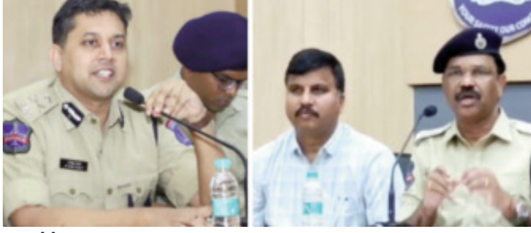
ద్వారా సీపీఎల్ ఏ నుండి రైతు బంధు పథకం యొక్క పట్టాదార్లు నంబర్, ఆధార్ కార్డులు, బ్యాంక్ 1వ షేజీని సేకరించడం ద్వారా వారి తరపున దరఖాస్తు చేస్తాడు. బ్యాంక్ ఖాతా నంబర్ ను సవరించడానికి పాస్ బుక్ వివరాలు. అతనికి అనేక బ్యాంకు ఖాతాలు ఉన్నాయి ఏ2 పేరు, అతను సైబరాబాద్, సంతోష్ నగర్, దిల్లూక్ నగర్ బ్యాంక్ ఖాతాలను తెరిచాడు, హైదరాబాద్ అంతటా వివిధ ప్రదేశాలు. ఇప్పటివరకు ఏ1 రైతు బంధును క్లెయిమ్ చేసి పొందారు. 130 మంది నాన్-క్లెయిండ్లూ, పట్టాదార్లు. ఆ విధంగా, ఏ2 తో కుమ్మత్తైన ఏ1 నిందితుడు ఓదెలు రైతు భీమా, రైతు బంధు కింద ప్రభుత్వ మొత్తాలను వీర స్వామి మోసం చేశాడు సుమారు రెండు కోట్లు. ఈ ఓ డబ్బు అధికారులు నిందితుల ఉదాహరణ నుండి మెటేరియల్ వస్తువులు, దాక్కుమెంటరీ నాన్ క్లెయిమ్లను స్వాధీనం చేసుకున్నారు, అంటే మెట్రెల్ ఫోన్లు-02, జాతీయం చేయబడిన బ్యాంకు డెబిట్ కార్డులు-07, నకిలీ, నకిలీ మరణ ధృవీకరణ పత్రాలు మరియు ఎల్ ఐ సి పత్రాలు -05 ఏ-1 ఇంటి నుండి. రైతు భీమా, రైతును దారి మళ్లించేందుకు నిందితులు పథకం వన్నినట్లు విచారణలో తేలింది. బంధు పథకం, రైతు భీమా, రైతు బంధు పోర్టల్ ద్వారా సీపీఎల్ ఏ నుండి డేటాను సేకరించి, ఎల్ ఐ సి నుండి 20 నకిలీ క్లెయిమ్లను క్లెయిమ్ చేసి, పట్టాదార్లు లేని 130 మందిని మోసం చేసి, రైతు బంధు నిధులను నిందితులు, ఏఈవో భార్య బ్యాంకు ఖాతాలకు రూపాయలను ఏఈవో తన సహచరుడి సహాయంతో మొత్తాలను డ్రా చేసి ఆస్తులు అంటే కొందర్ గ్రామంలో ఎకరాల 2.35 గంటల వ్యవసాయ భూమి, తుమ్మలపల్లి గ్రామంలో ఎకరాల 8.20 గంటల వ్యవసాయ భూమి, అలాగే 183 చదరపు చార్ సైట్ల ఓపెన్ ప్లాట్ ను కూడా కొనుగోలు చేశారు. ఏఈవో భార్య పేరు మీద కొనుగోలు చేసిన ఆస్తులన్నీ మహేశ్వరి. శ్రీను కేసు దర్యాప్తు చేస్తున్నా ఎ. శ్రీధర్, ఇన్ స్పెక్టర్ ఆఫ్ పోలీస్, ఆర్థిక నేరాల విభాగం, సైబరాబాద్, పర్యవేక్షణలో. కె. ప్రసాద్, డి.సి. కమీషనర్ ఆఫ్ పోలీస్, ఈ ఓ డబ్బు, కేసు నమోదు చేసి విచారణ చేస్తున్న సైబరాబాద్ పోలీసులు.