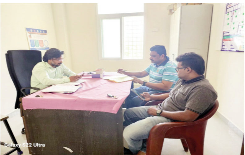
రాయచోటి ఫిబ్రవరి 10 తరణం ప్రతినిధి పట్టణ ఆరోగ్య కేంద్రాలు వందశాతం లక్ష్యాలు సాధించాలని అన్నమయ్య జిల్లా జాతీయ ఆరోగ్య మిషన్ పర్యవేక్షణ అధికారి