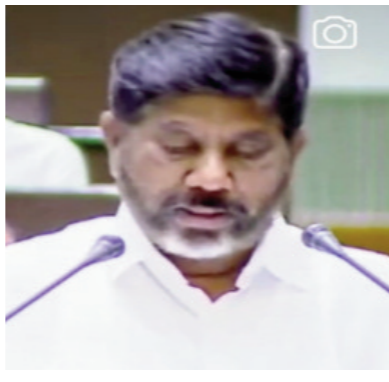
డిప్యూటీ సీఎం, ఆర్థిక మంత్రి భట్టి విక్రమార్క ఓట్ ఆన్ అకౌంట్ బడ్జెట్ ను ప్రవేశపెట్టారు.

శేరిలింగంపల్లి, ఫిబ్రవరి 10 (తరణం ప్రతినిధి): హైదరాబాద్ తెలంగాణ రాష్ట్ర ప్రభుత్వం శాసనసభలో డిప్యూటీ సీఎం, ఆర్థిక మంత్రి భట్టి విక్రమార్క ఓట్ ఆన్ అకౌంట్ బడ్జెట్ను ప్రవేశపెట్టారు. 2024-25 ఆర్థిక సంవత్సరానికి రూ. 2,75,891 కోట్లతో ఓట్ ఆన్ అకౌంట్ బడ్జెట్ను ప్రవేశపెట్టినట్లు ఆయన తెలిపారు. రెవెన్యూ వ్యయం 2,01,178 కోట్లు, మూలధన వ్యయం 29,669 కోట్లు, సీమీపాదల శాఖకు 28,024 కోట్లు, వ్యవసాయ శాఖకు 19,746 కోట్లు, విద్యారంగానికి 21,389 కోట్లు, వైద్యారంగం 11,500 కోట్లు, గృహశాఖకు 2,418 కోట్లు, ట్రాన్స్ కో, డిస్కంకు 16,825 కోట్లు, గృహ నిర్మాణ శాఖకు 7,740 కోట్లు, పరిశ్రమల శాఖకు 2,543 కోట్లు కేటాయించు, బట్టి శాఖకు 774 కోట్లు కేటాయించు, పంచాయతీ రాజ్, గ్రామీణాభివృద్ధి శాఖకు 40,080