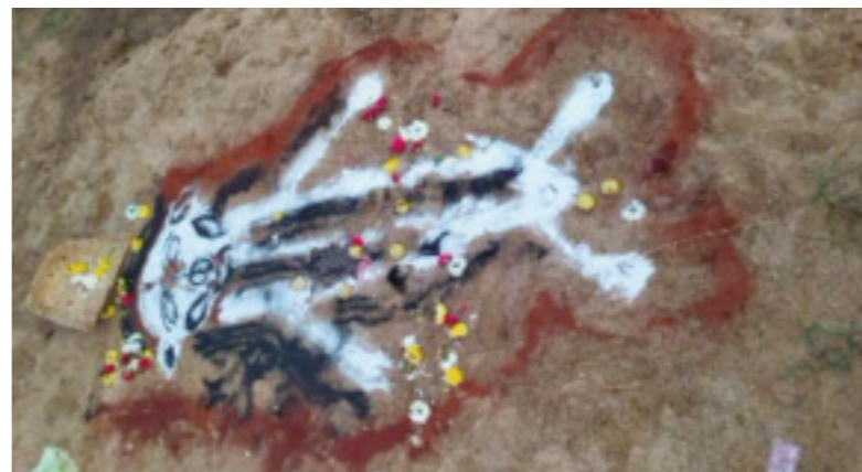
ప్రజలను భయంతో గురి చేస్తున్న వారిపై పోలీసులు కఠిన చర్యలు తీసుకోవాలని గ్రామస్థులు కోరుతున్నారు.

నెల్లూరు ఫిబ్రవరి 10(తరణం బ్యూరో) నెల్లూరు జిల్లాలో రోజురోజుకూ క్షుద్ర పూజలు ఎక్కువ అవుతున్నాయి. అమావాస్య వచ్చిందంటే చాలు ఏదో ఒక చోట క్షుద్ర పూజలు కలకలం రేపుతున్నాయి. వివరలోకి వెళ్తే, బుచ్చిరెడ్డిపాలెం మండలం దామర మడుగు పల్లి పాలెం గ్రామంలో లో వరుస క్రమంలో క్షుద్ర పూజలు జరుగుతున్నాయి. గతంలో కూడా ఇదే దామరమడుగు పల్లిపాలెం వరుసుగా క్షుద్ర పూజలు జరిగాయి. అప్పట్లో ఆ సంఘటన ప్రజలను భయందోలనకు గురిచేసింది. ఇలా క్షుద్ర పూజలు చేస్తే ఎవరినైనా వశ పరుచుకోవచ్చని లేదా ఆస్తులు కాచేయొచ్చని ఇలాంటి చర్యలు కు పాల్పడుతున్నారు. తాజాగా ఈరోజు అదే దామరమడుగు పాలెం లో భయంకరమైన బొమ్మ వేసి పసుపు కుంకుమతో పూజలు చేసిన ఘటన చోటుచేసుకుంది. ఉదయం పెన్నా తీరం కు వెళ్లిన గ్రామస్థులు ఈ బొమ్మను గమనించి భయంతోలనకు గురయ్యారు. ఇలా క్షుద్ర పూజలు అని, భాణమతి అని