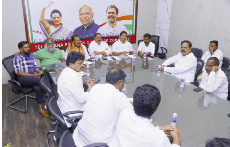
ఇంచార్జిలు, ముఖ్యనాయకులు తదితరులు పాల్గొన్నారు.