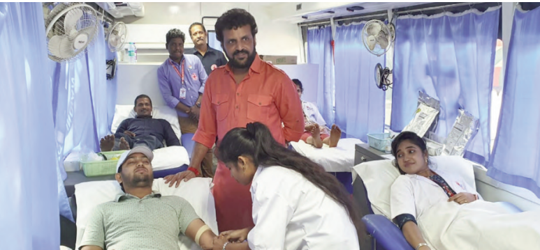
(అనకాపల్లి.జనవరి29, తరణం ప్రతినిధి)బ్రాండిక్స్ ఇండియా అపెరల్ సిటీ (బీఐసీ) వారి బ్రాండిక్స్ భారత్ ట్రస్ట్ ఆధ్వర్యంలో ఇండియన్ రెడ్ క్రాస్ సొసైటీ వారి సహకారంతో

పది రక్తదాన శిబిరాల ద్వారా 180 మంది రక్తదానం