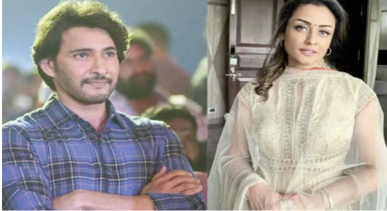
అని అన్నారు. దీనికి సంబంధించిన వీడియోను ఇన్స్టాలో షేర్ చేసిన సత్తుత ఈ పోస్ట్ చేశారు.

ఇంటర్వెయ్: జనవరి 10 (తరణం బ్యూరో) మహేశ్బాబు అభిమానులను ఉద్దేశించి సత్తుత ఆసక్తికర పోస్ట్ పెట్టారు. "మహేశ్ అభిమానుల గురించి ఇప్పటికే ఎంతోమంది గొప్పగా చెప్పారు. తెలుగు రాష్ట్రాల్లోనే కాకుండా ప్రపంచవ్యాప్తంగా ఎంతోమంది ఆయన్ని ఆదరిస్తున్నారు. ప్రతి ప్రయత్నంలో అండగా నిలిచి.. మరింత కష్టపడి పనిచేసేందుకు దోహదపడుతున్నారు. (గుంటూరు ప్రీ రిలీజ్ ఈవెంట్ ను ఉద్దేశించి) గుంటూరులో అభిమానులు చూపించిన ప్రేమను చూసి ఓ విషయం గర్వంగా చెప్పాలని ఉంది. మహేశ్.. అభిమానులకు మీరాక ఎమోషన్. ఈ ప్రేమ ఇలాగే కొనసాగాలని కోరుకుంటున్నా" అని పేర్కొన్నారు. మహేశ్ హీరోగా నటించిన 'గుంటూరు కారం' సంత్రాంతి కానుకగా జనవరి 12న ప్రేక్షకుల ముందుకు రానుంది. ఈ సినిమా ప్రీరిలీజ్ ఈవెంట్లో అభిమానులనుద్దేశించి మాట్లాడుతూ మహేశ్ భావోద్వేగానికి గురయ్యారు. "మీరప్పుడూ నా గుండెల్లో ఉంటారు. సంత్రాంతి నాకు, నాన్నగారికి బాగా కలిసొచ్చిన పండుగ. ఆ సీజన్లో మా చిత్రం విడుదలైతే అది భాగ్యవశ్యం. ఈసారి కూడా అదే రిపీట్ అవుతుంది. కానీ, ఇప్పుడు నాన్న లేరు. ఆయన నా సినిమాలు చూసి రికార్డులు, కలెక్షన్ల గురించి చెబుతుంటే ఆనంద పడేవాడిని. ఆ సంగతులన్నీ మీరే చెప్పాలి. ఇక నుంచి మీరే నాకు అమ్మ, నాన్న"