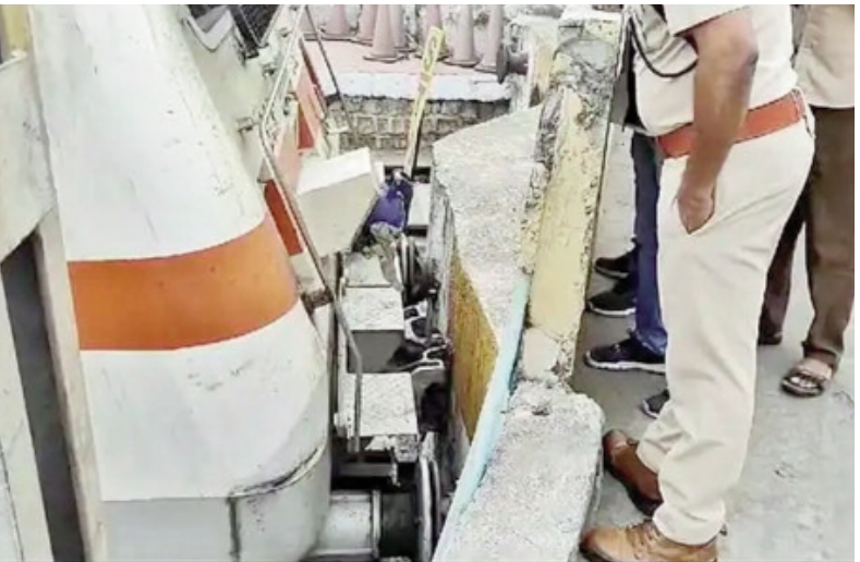
రాకపోకలు సాగాయి. ఈ రోజు షెడ్యూల్ లో ఉన్న ప్యాసింజర్ రైళ్లను నడిపారుప్రమాదంపై మంత్రి పొన్నం ప్రభాకర్ ఆరాచార్మినార్ ఎక్స్ప్రెస్ ప్రమాదంపై హైదరాబాద్ జిల్లా ఇంచార్జ్ మంత్రి పొన్నం ప్రభాకర్ ఆరా తీశారు. పట్టాలు కొద్దిగా పక్కటి ఒరగడంతో పెను ప్రమాదం తప్పిందన్నారు. జిల్లా యంత్రాంగం సహాయక చర్యలు చేపట్టాలని, గాయపడిన ప్రయాణికులకు సరైన వైద్యం అందించాలని అధికారులను మంత్రి ఆదేశించారు

హైదరాబాద్: జనవరి 10 (తరణం బ్యూరో)నాంపల్లి రైల్వే స్టేషన్లో బుధవారం ఉదయం ప్రమాదానికి గురైన చార్మినార్ ఎక్స్ప్రెస్ ను అధికారులు పునరుద్ధరించారు. పునరుద్ధరణ పనుల నేపథ్యంలో ఎంఎంటీఎస్ రైల్వేకు మినహాయింది..ఇతర ఏ సర్వీసులకు ఇబ్బంది కలగలేదని దక్షిణ మధ్య రైల్వే అధికారులు వెల్లడించారు. ప్రమాద రైలు కోచ్ లని టెస్టింగ్ కోసం షెడ్యూల తరలించినట్లు తెలిపారు.చార్మినార్ ఎక్స్ప్రెస్ కు ఈ ఉదయం ప్రమాదం జరిగింది. చెన్నై నుంచి హైదరాబాద్ కు చేరుకునే క్రమంలో.. పట్టాలు తప్పి ఫ్లాట్ ఫామ్ సైడ్ వాల్ ను ఢీకొట్టింది. రైలు స్లోగా ఉండడంతోనే పెను ప్రమాదం తప్పింది. అయితే ఈ ఘటనలో ఆరుగురికి గాయాలయ్యాయి. వారిని చికిత్స కోసం ఆసుపత్రికి తరలించారు. మొత్తం మూడు బోగీలు పట్టాలు తప్పగా, ప్రయాణికులు భయాందోళనకు గురయ్యారు. నాంపల్లి చివరి స్టేషన్ కావడంతో రైలు డెడ్ ఎండ్ కు వచ్చిన తర్వాతే ప్రమాదం జరిగిందని సీఐఆర్వో రాకేష్ తెలిపారు. డ్రైవర్ సదన్ గా బ్రేక్ వేయడంతోనే రైలు పట్టాలు తప్పిందన్నారు.ఇక దక్షిణ మధ్య రైల్వే అదనపు జనరల్ మేనేజర్ ధనంజయులు నేతృత్వంలోని రైల్వే అధికారుల బృందం సహాయ, పునరుద్ధరణ చర్యలను చేపట్టింది. సౌత్ సెంట్రల్ సర్కిల్ రైల్వే స్టేషీ కమిషనర్ సంఘటనపై చట్టబద్ధమైన విచారణను నిర్వహిస్తుందని తెలిపారు.ఎంఎంటీఎస్ రైల్వే రద్దనాంపల్లి రైల్వేస్టేషన్లో సహాయక చర్యల దృష్ట్యా పలు ఎంఎంటీఎస్ రైల్వేకు రద్దు చేశారు నాంపల్లి-మేడ్చల్, మేడ్చల్- హైదరాబాద్, హైదరాబాద్ లింగంపల్లి ఎంఎంటీఎస్ రైల్వేకు దక్షిణ మధ్య రైల్వే రద్దు చేసింది. అయితే నాంపల్లి రైల్వే స్టేషన్లో ఫ్లాట్ ఫారమ్ 1,2 వైపు నుంచి రైల్