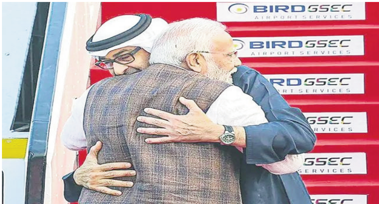
సుజాకీ తదితరులు వీరిలో ఉన్నారు. గాంధీనగర్లో 'వైబ్రంట్ గుజరాత్ గ్రోబల్ ట్రేడ్ షో-2024'ను మోదీ ప్రారంభించారు. వైబ్రంట్ గుజరాత్ సదస్సు నేపథ్యంలో 2 లక్షల చదరపు మీటర్లలో ఈ ప్రదర్శన ఏర్పాటు చేశారు.