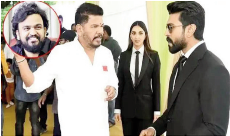
శీలక పాత్రలో కనిపించనున్నారు. తమస్ స్వరాలు అందిస్తున్నారు. ప్రస్తుతం ఇది చిత్రీకరణ దశలో ఉంది. సెప్టెంబర్లో దీనిని విడుదల చేస్తామని ఇటీవల దిల్ రాజు చెప్పారు.