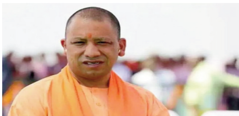
లఖ్నో: జనవరి 04 (తరణం బ్యూరో)అయోధ్యలో నిర్మించిన రామ మందిరంతో