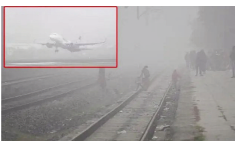
ఆలస్యంగా ప్రయాణించనున్నట్లు అధికారులు ప్రకటించారు. ఇదిలా ఉండగా, దక్షిణ భారతంలో పలుచోట్ల మోస్తరు వర్షాలు కురుస్తున్నాయి. ఈ క్రమంలో శీతల గాలుల కారణంగా చలి తీవ్రత పెరిగింది.

దీర్ఘి: జనవరి 04 (తరణం బ్యూరో)ఉత్తరాదిన పొగమంచు తీవ్ర ప్రభావం చూపుతోంది. భారీగా కురుస్తున్న పొగమంచు కారణంగా విమానాలు, రైళ్లు ఆలస్యంగా నడుస్తున్నాయి. పొగమంచు కారణంగా పలు చోట్ల విద్యాసంస్థలను సెలవు కూడా ప్రకటించారు.ఇక, వాహనదారులు కూడా తీవ్ర ఇబ్బందులు ఎదుర్కొంటున్నారు.ఇక, ఐఎండీ అంచనాల ప్రకారం.. మరో రెండు రోజులు కూడా ఈ చలి ఉష్ణోగ్రతలు ఉండే అవకాశం ఉంది. ఉత్తరాదితోపాటు తూర్పు భారతదేశంలో కూడా కనిష్ట ఉష్ణోగ్రతలు సమాదవుతాయని అధికారులు తెలిపారు. రానున్న రెండు, మూడు రోజుల్లో 2 నుంచి 3 డిగ్రీల సెల్సియస్ వరకు పెరిగే అవకాశం ఉందని వెల్లడించారు. ఇక మధ్య భారతంలో చలి తీవ్రత రాబోయే మూడు రోజులు ఉంటుందని వాతావరణ శాఖ తెలిపింది.వివరాల ప్రకారం.. దీర్ఘి, ఉత్తరప్రదేశ్, చండీగఢ్, రాజస్థాన్, బీహార్, మధ్యప్రదేశ్, త్రిపుర, జమ్మూ ప్రాంతాల్లో దట్టమైన పొగమంచు అలుముకుంది. గురువారం తెల్లవారజాము నుంచే దట్టమైన పొగమంచు కమ్ముకుంది. ఉదయం ఏడు గంటలు దాటినా రోడ్డు కనిపించకపోవడంతో వాహనదారులు ఇబ్బందులకు గురవుతున్నారు. మరోవైపు, పొగమంచు ప్రభావం అటు విమానాలు, రైళ్ల రాకపోకలపై కూడా పడుతుండటంతో పలు సర్వీసులు ఆలస్యంగా నడుస్తున్నాయి. పొగమంచు కారణంగా ఢిల్లీలో పలు విమానాలు