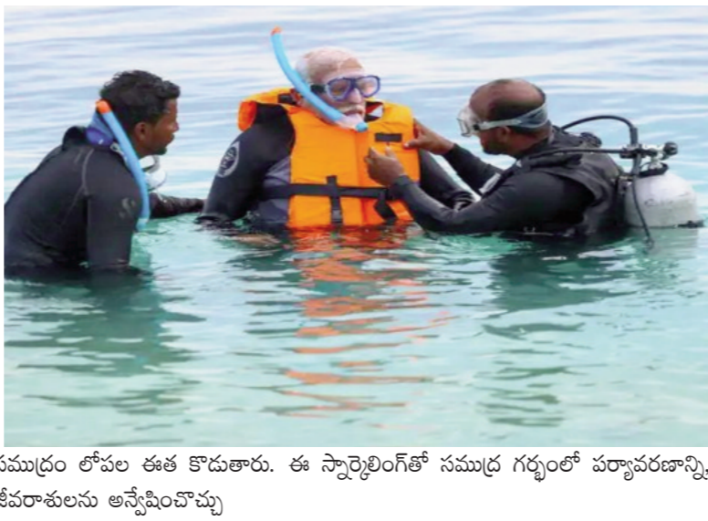
సముద్రం లోపల ఈత కొడుతారు. ఈ స్నార్కెలింగ్తో సముద్ర గర్భంలో పర్యావరణాన్ని, జీవరాశులను అన్వేషించాచ్చు

దీర్ఘి: జనవరి 04 (తరణం బ్యూరో)లక్షద్వీప్ లో ప్రధాని నరేంద్ర మోదీ బుధవారం పర్యటించారు. ఈ సందర్భంగా అక్కడి ప్రకృతి అందాలను ఆయన ఆస్వాదించారు. సముద్రం ఒడ్డున కూర్చుని కొంతసేపు సేద తీరారు.అంతేకాదు.. సముద్రంలో స్నార్కెలింగ్ (సాహసంతో కూడిన స్విమ్మింగ్) కూడా చేశారు. సముద్ర గర్భంలోని పగడపు దిబ్బలు, జీవరాశులను ప్రత్యక్షంగా వీక్షించారు.ఇందుకు సంబంధించిన ఫోటోలను ప్రధాని తన 'ఎక్స్' ఖాతాలో పంచుకున్నారు. "లక్షదీవుల సౌందర్యం, అక్కడి ప్రజల మమకారం చూసి నేనింకా సంభ్రమాశ్చర్యంలోనే ఉన్నా. ప్రకృతి అందాలు, ప్రశాంతమైన వాతావరణంతో ఈ దీవులు మనల్ని మంత్రముగ్ధులను చేస్తున్నాయి. 140కోట్ల మంది భారతీయుల సంక్షేమం కోసం నేను మరింత కష్టపడి ఎలా పనిచేయాలో ఈ వాతావరణం నాకు నేర్పింది. సాహసాలు చేయాలనుకునేవారు.. మీ లిస్ట్లో లక్షద్వీప్ను కూడా చేర్చుకోండి" అని మోదీ రాసుకొచ్చారు.లక్షద్వీప్లో తాను స్నార్కెలింగ్ కూడా ప్రయత్నించినట్లు మోదీ తెలుపుతూ ఆ చిత్రాలను కూడా షేర్ చేశారు. పగడపు దీవులు, చేపల ఫోటోలను పంచుకున్నారు. 'ఇది ఎంతో అద్భుతమైన అనుభవం' అని పేర్కొన్నారు. స్నార్కెలింగ్ అనేది సముద్రంలో చేసే ఓ తరహా డైవింగ్ లాంటిది. స్నార్కెల్ అనే ట్యాబ్, డైవింగ్ మాస్క్ను ముఖానికి ధరించి